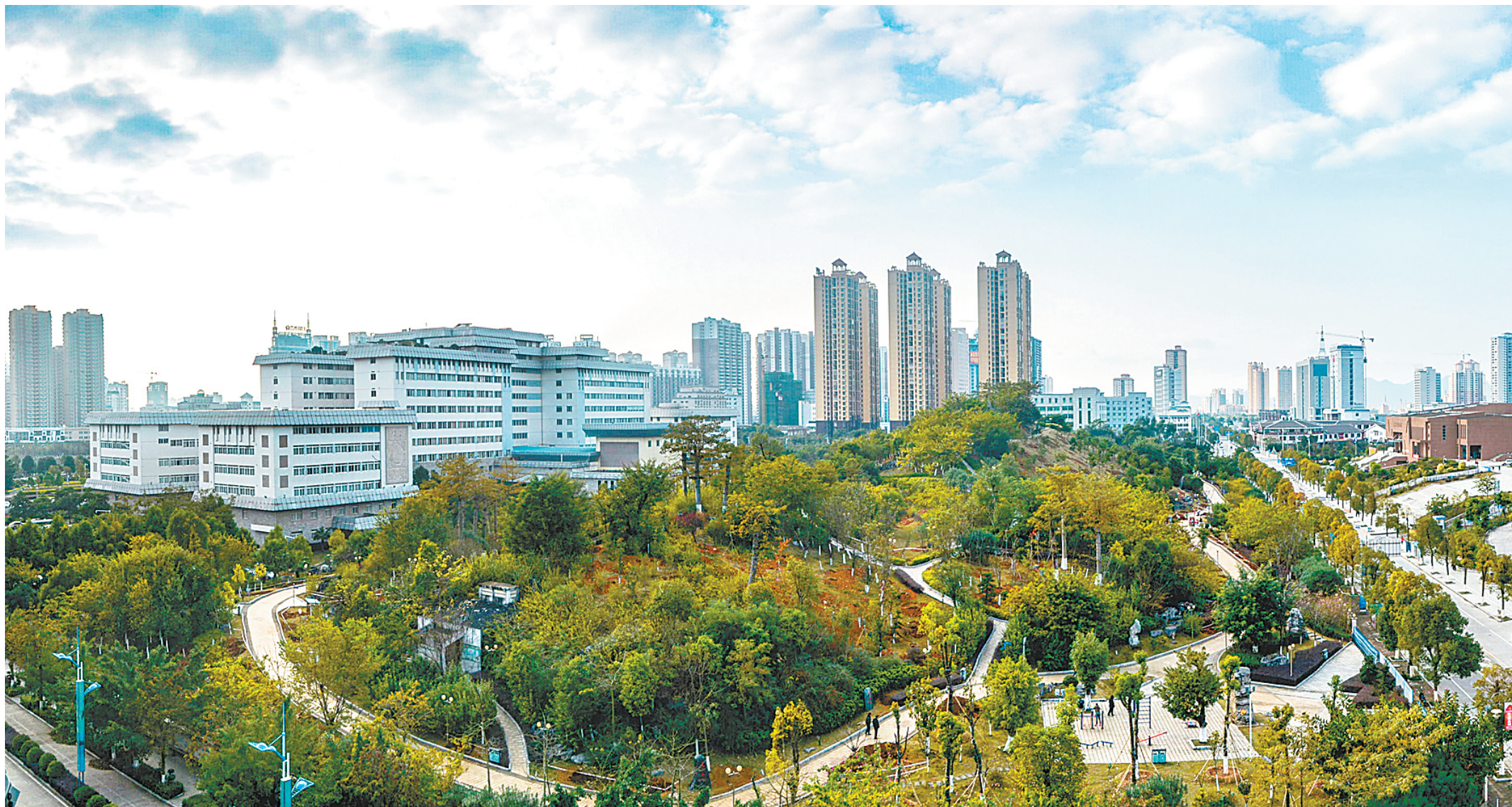
▲翠屏山公园新貌。

市园林局公园管理科的周建枚则表示，自从2010年对三大公园改造后，我市采用了“政府购买服务”的方式，由专门公司维护公园，提升了公园的管理质量。今年，他们将继续更新各公园的树种、座椅板凳、步道等，向打造“精品公园”的方向努力。到2018年，城区三大公园还将迎来新的“小伙伴”——占地81公顷的城南新区公园，届时市民又将增加一个游玩的好去处。