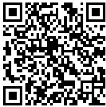
▲想欣赏更多城区公园美图，请扫来宾壹报二维码。