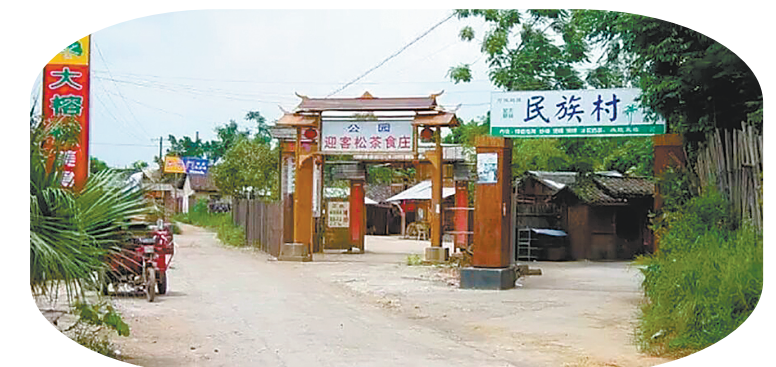
▲改造前的人民公园，被大排档、卡拉OK厅占据。(资料图)