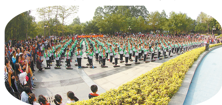
▲现在的人民公园是市民开展文艺活动的大舞台。