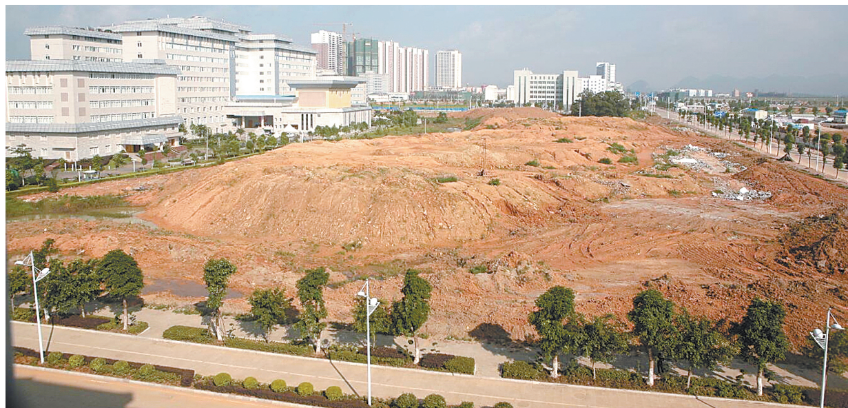
▲建设中的翠屏山公园。