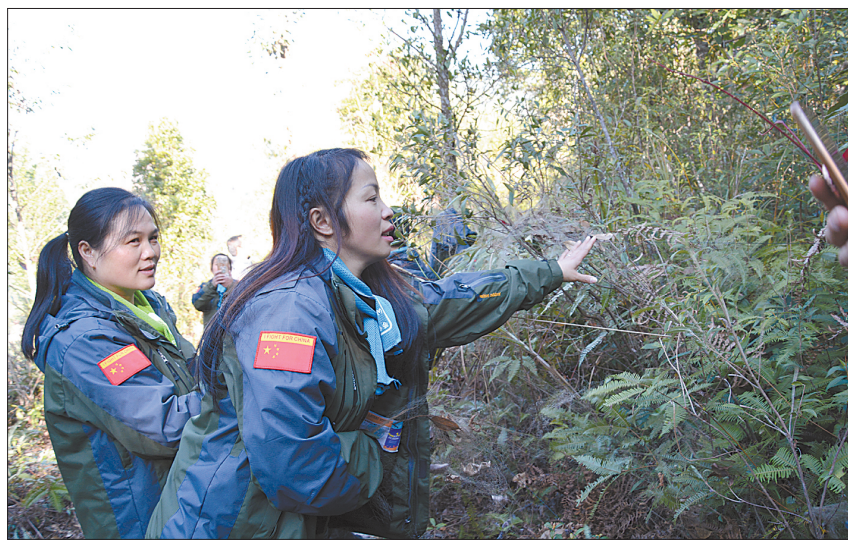
▲正值北鸟南迁过冬时节,大瑶山野生动植物保护宣传队联合金秀瑶族自治县森林公安局干警进山宣传、巡查,成功捣毁2处鸟窝。图为12月19日,宣传队队员正在捣毁鸟窝、鸟蛋。(吴金莲 摄)

建治安联防大队,各村相应组建联防分队,对辖区11个村委进行常态化巡逻,重点对马上、莆田、都满、福隆等治安乱点村屯(区域)进行24小时不定时巡逻防范,最大限度地挤压违法犯罪空间。同时整合力量开展春秋两季严打整治,重拳打击群众反映强烈、严重影响群众生产生活的盗窃案件和赌博违法行为。今年1至11月,全镇共破获刑事案件31起,刑拘21人,查处行政案件42起,拘留61人。(罗克观)