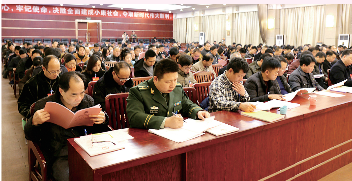
▲政协武宣县第九届委员会第三次会议开幕式现场。