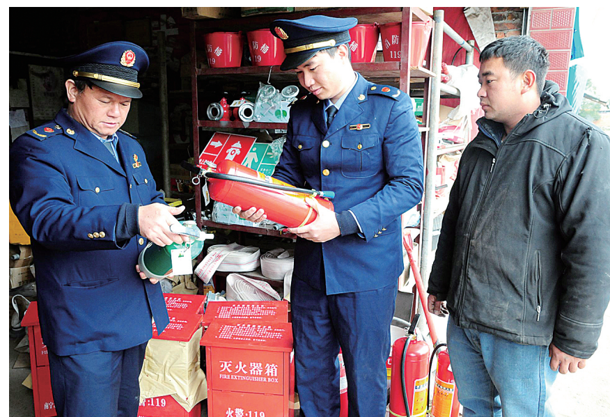
▲春节临近,市工商局积极开展消防器材市场大检查,主要检查是否有营业执照、是否建立进货台账、是否有合格证、是否有商标侵权违法行为、是否有虚假广告宣传等。图为2月6日,该局执法人员在抽查消防器材质量。

该县还通过创建“清廉瑶山”微信公众号,打造廉洁教育基地,制作微电影等形式,加强对扶贫政策的宣传,提高群众参与积极性,为脱贫攻坚工作注入“防腐剂”。