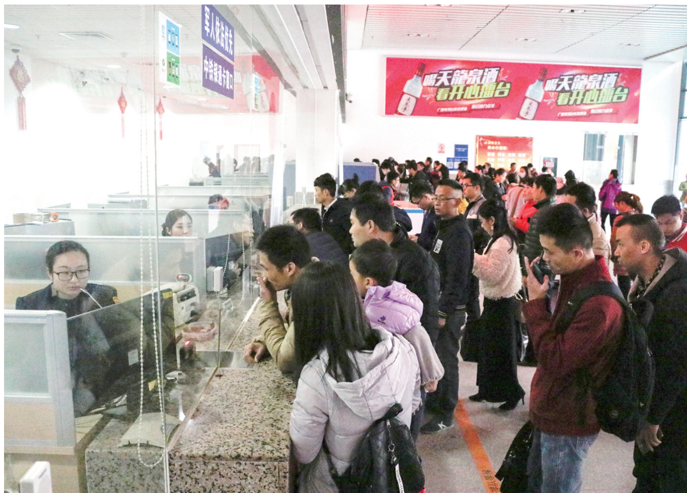
▲在来宾北站售票厅,旅客有序地排队购票。

记者在高速路来宾收费站外广场看到,收费站不断有轿车、客车出入,收费站内广场和外广场均没有出现拥堵情况。据柳州高速来宾分公司工作人员介绍,今年春节假期,虽然高速公路对7座以下(含7座)小客车实行免费通行政策,高速公路的车流量有所增多,但来宾收费站并没有出现拥堵的情况。