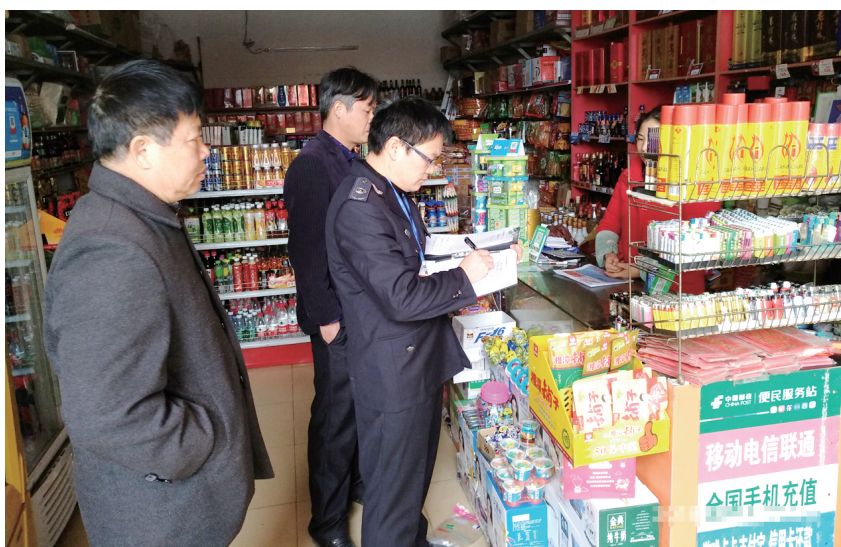
▲今年春节前,兴宾区安监局执法人员对杂货店销售烟花爆竹情况进行检查。(晚刊见习记者 黄伟 摄)

2017年,春节大年初一,央视的一则新闻在我市引起震动:按PM2.5小时峰值浓度排序,除夕夜受烟花爆竹燃放影响最大的十个全国地级城市中,来宾市位列第二! 究其原因,一是我市为蔗糖大市,每年秋冬榨糖季,蔗农在收割甘蔗后都有焚烧蔗叶的习惯,因此产生的大量浓烟直接影响了周边环境的空气质量;二是城区内春节前燃放烟花爆竹、工地扬尘、烧烤油烟也直接或间接降低了空气质量,使得群众苦不堪言。 空气质量警报就是动员令! 2017年2月6日,来宾市人民政府发布《关于禁止燃放烟花爆竹的通告》,在城区划定禁燃区,并规定全年禁燃。 同年2月28日,我市召开城市环境综合整治和改善空气质量“百日大行动”动员会,决定从2月20日至5月31日,用100天时间开展城市环境综合整治和改善空气质量整治行动,进一步改善城市环境,提高城市管理水平。