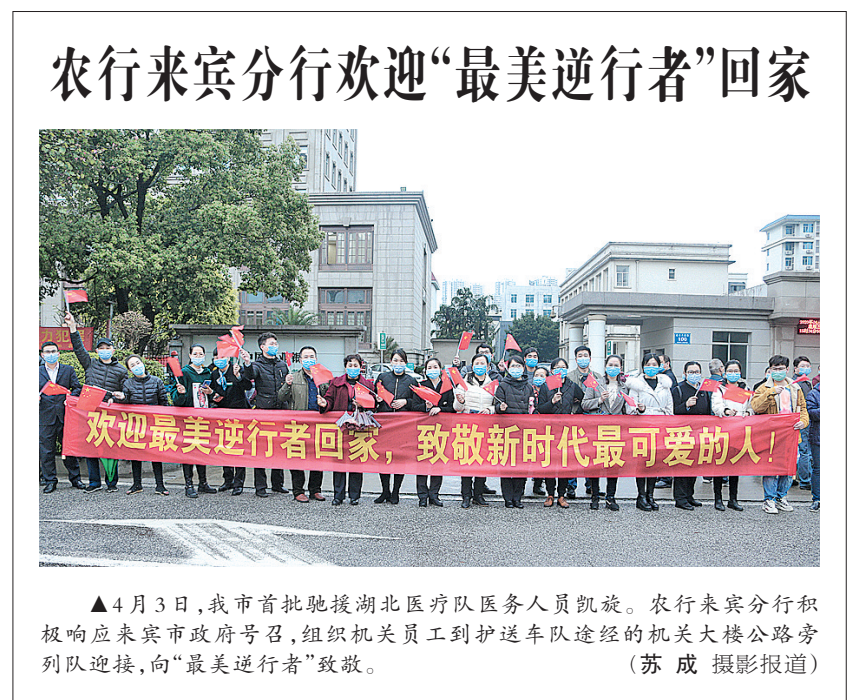
▲4月3日,我市首批驰援湖北医疗队医务人员凯旋。农行来宾分行积极响应来宾市政府号召,组织机关员工到护送车队途经的机关大楼公路旁列队迎接,向“最美逆行者”致敬。

视社区防控工作,多次作出重要指示,对社区工作者给予肯定,还先后到北京市安华里社区、武汉市东湖新城社区考察慰问。近日,武汉市东湖新城社区全体社区工作者给习总书记写信,表达了对总书记和党中央的感激之情,以及继续坚守好阵地、履行好职责的坚强决心。