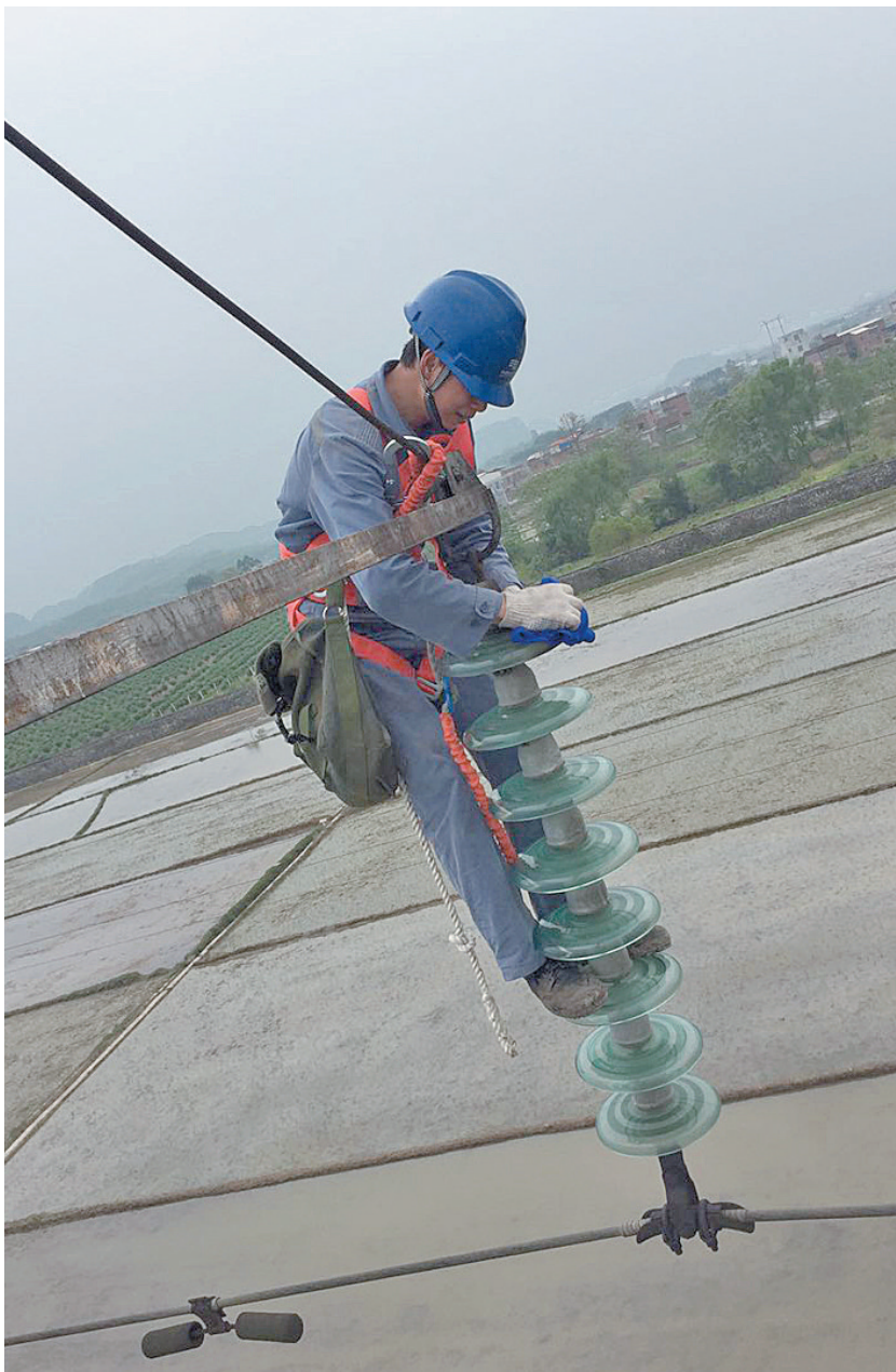
▲3月26日,来宾供电输电管理所电网工人正在更换绝缘子、检查避雷器等电力设备。