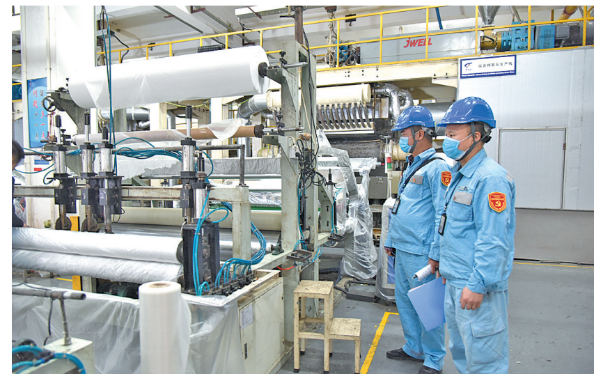
▲3月17日,来宾供电局供电服务中心电网工人到广西德福莱医疗器械有限公司检查生产用电,确保该企业生产供电平稳。