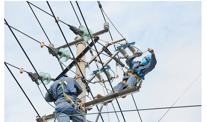
▲2月10日,武宣县中医院专变变压器B相设备线夹断裂故障,武宣供电局党员突击队第一时间进行抢修处理。

根据重点工程项目实际,电力部门科学制定方案,推进工程项目复工;开通业务办理绿色通道,确保企业用电;保障春耕生产、农产品深加工等电力供应,助力脱贫攻坚。