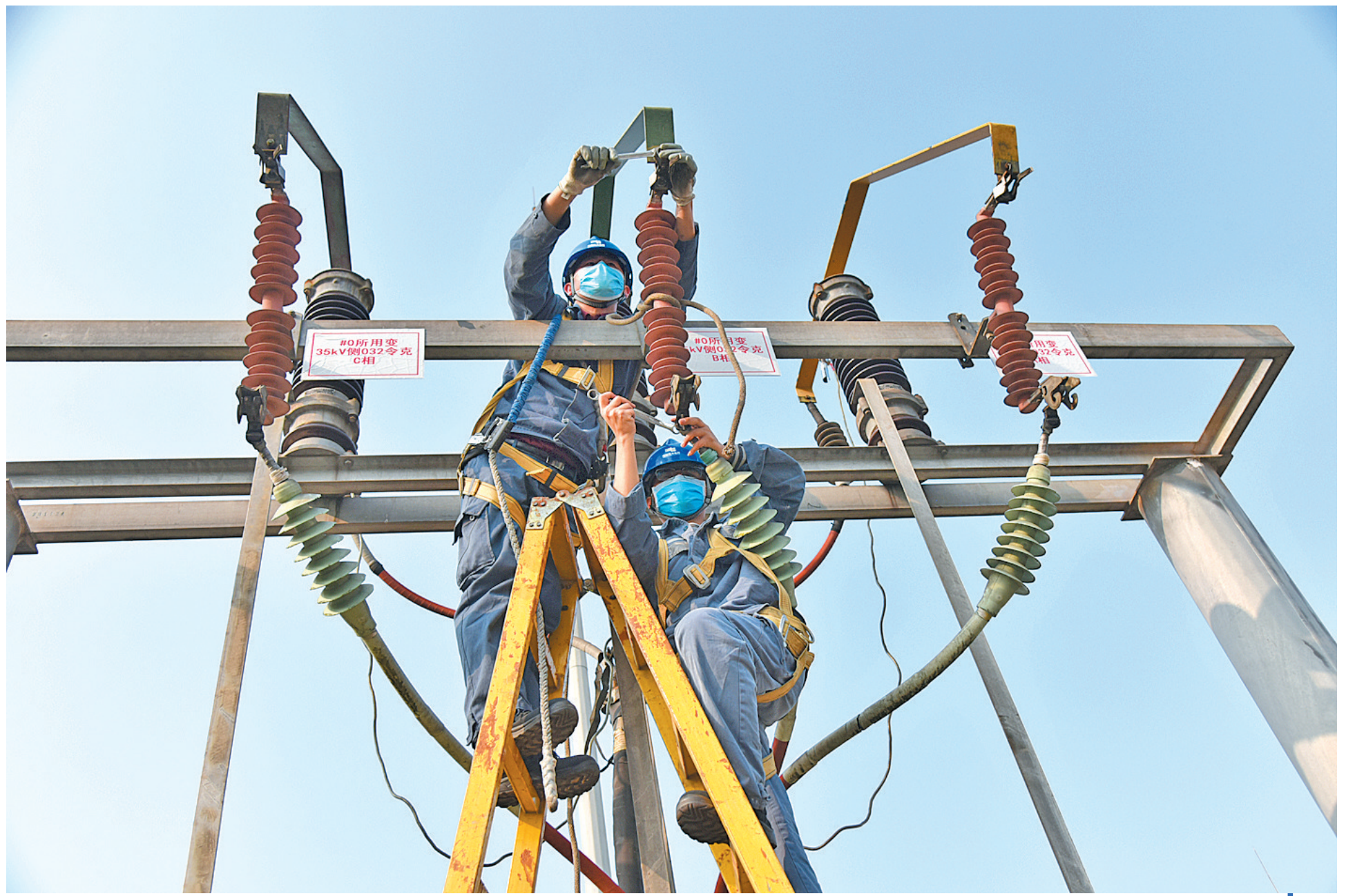
▲3月10日,来宾供电局进行接管500千伏溯河变电站后首次停电作业。据了解,溯河变电站在来宾市供电网区中起着至关重要的作用,承担着来宾大量的工业企业及居民用电,并在西电东送的通道中占据重要地位。