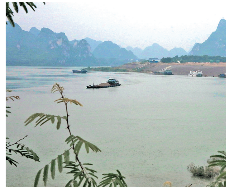
▲4月16日,一艘装满货物的轮船正开足马力往下游行驶。