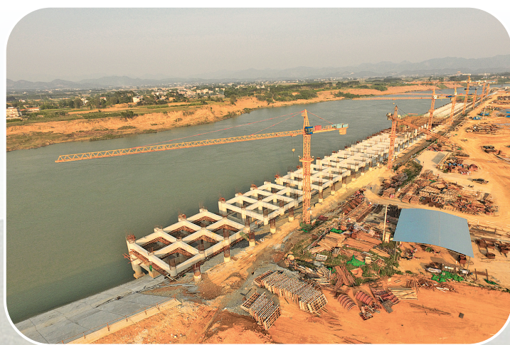
▲4月14日,在来宾港武宣港区龙从作业区,八台塔吊机正忙碌作业。