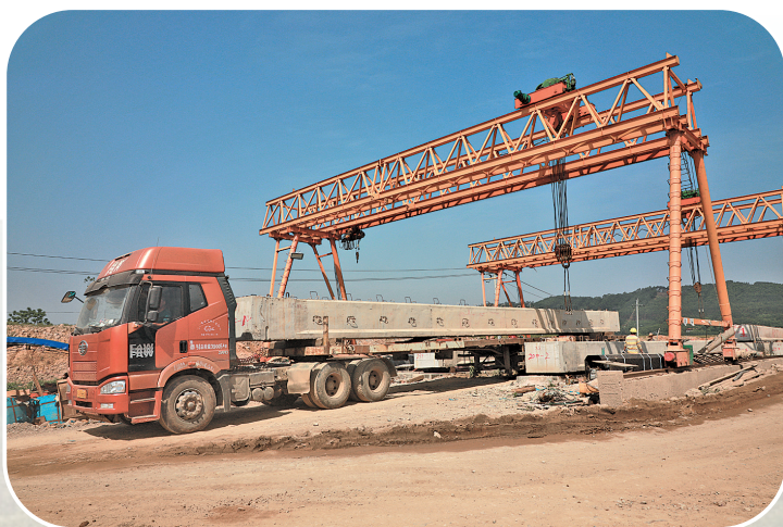
▲4月15日,工程车在大藤峡项目建设工地忙碌。