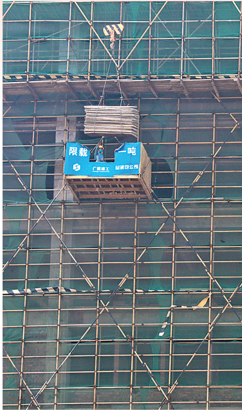
▲4月16日,工人在武宣县中医院综合楼建设工地忙碌作业。

该县处级领导干部及全县各专班纷纷进企业、进工地,组织工作组为企业提供后勤生活必需品配送保障,加强企业复工复产必须的原材料和运输车辆等重要物资调度保障,切实解决重大项目复工复产中遇到的实际困难,帮助企业落实疫情防控和复工复产。据统计,该县已为39个重大项目提供3.1万个口罩及测温仪、消毒用品一批。截至3月30日,该县复工复产项目39个,其中自治区重大项目已复工7个,复工率100%。