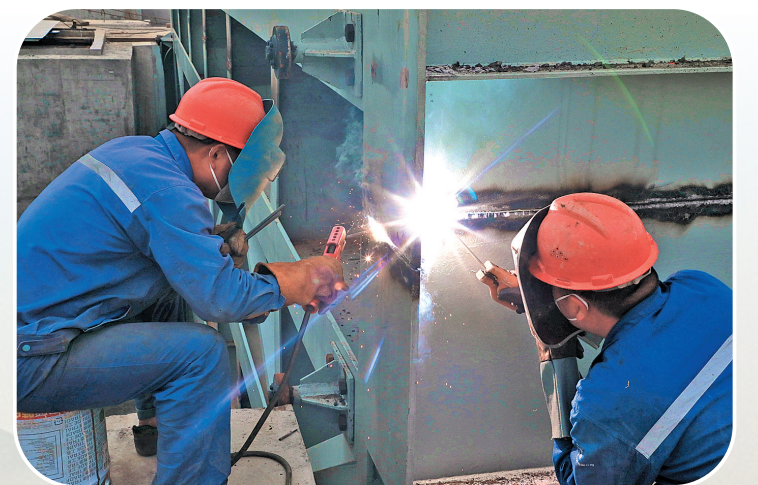
▲4月16日,两名工人在项目工地进行电焊施工。