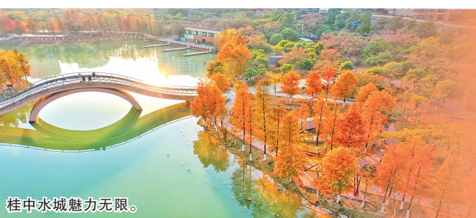
桂中水城魅力无限。