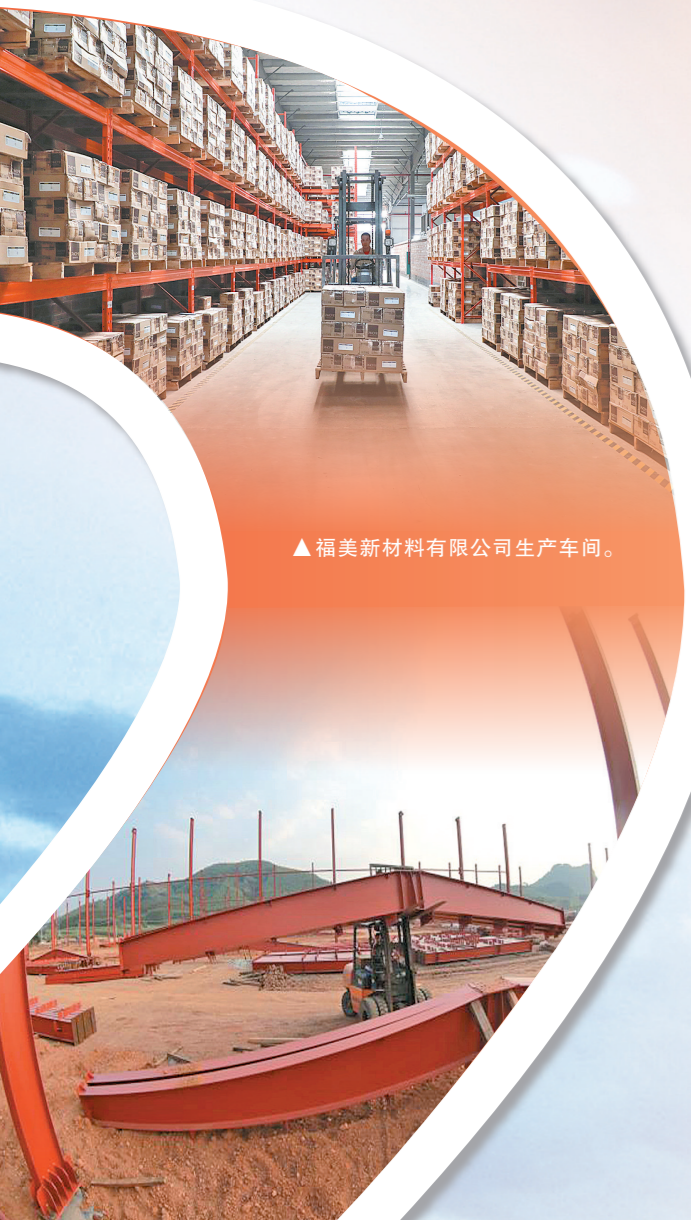
▲福美新材料有限公司生产车间。