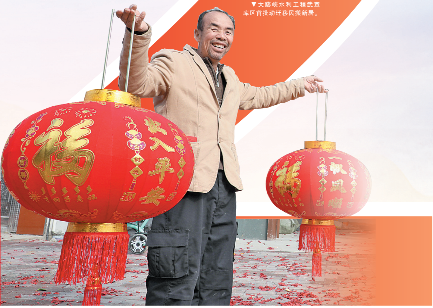
▼大藤峡水利工程武宣库区首批动迁移民搬新家。