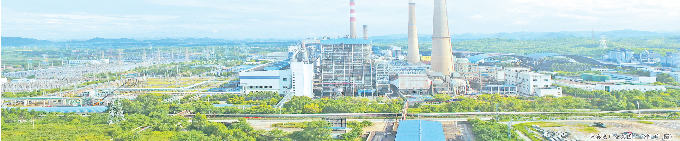
来宾电厂全景图。

来宾发电、来宾电厂以“海文化”作为企业文化特色,以“兴桂标杆、世界强企”为企业愿景,发扬“责任、担当、进取、包容”的企业精神,深挖潜力,创新变革,积极履行社会责任。企业先后获得全国电力系统双文明单位、全国模范职工之家、自治区和谐企业、全国安康杯竞赛组织优胜单位等一系列殊荣;涌现全国人大代表、全国工人先锋号、广西劳模模范、广西工匠、广西五一巾帼标兵、五一劳动奖章等优秀模范人物。