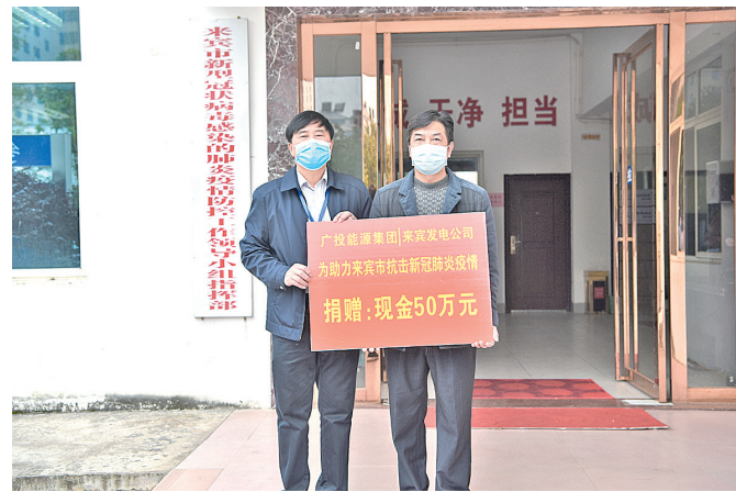
▲来宾发电、来宾电厂将50万元无偿捐赠给来宾市红十字会,用于新冠肺炎疫情防控工作。