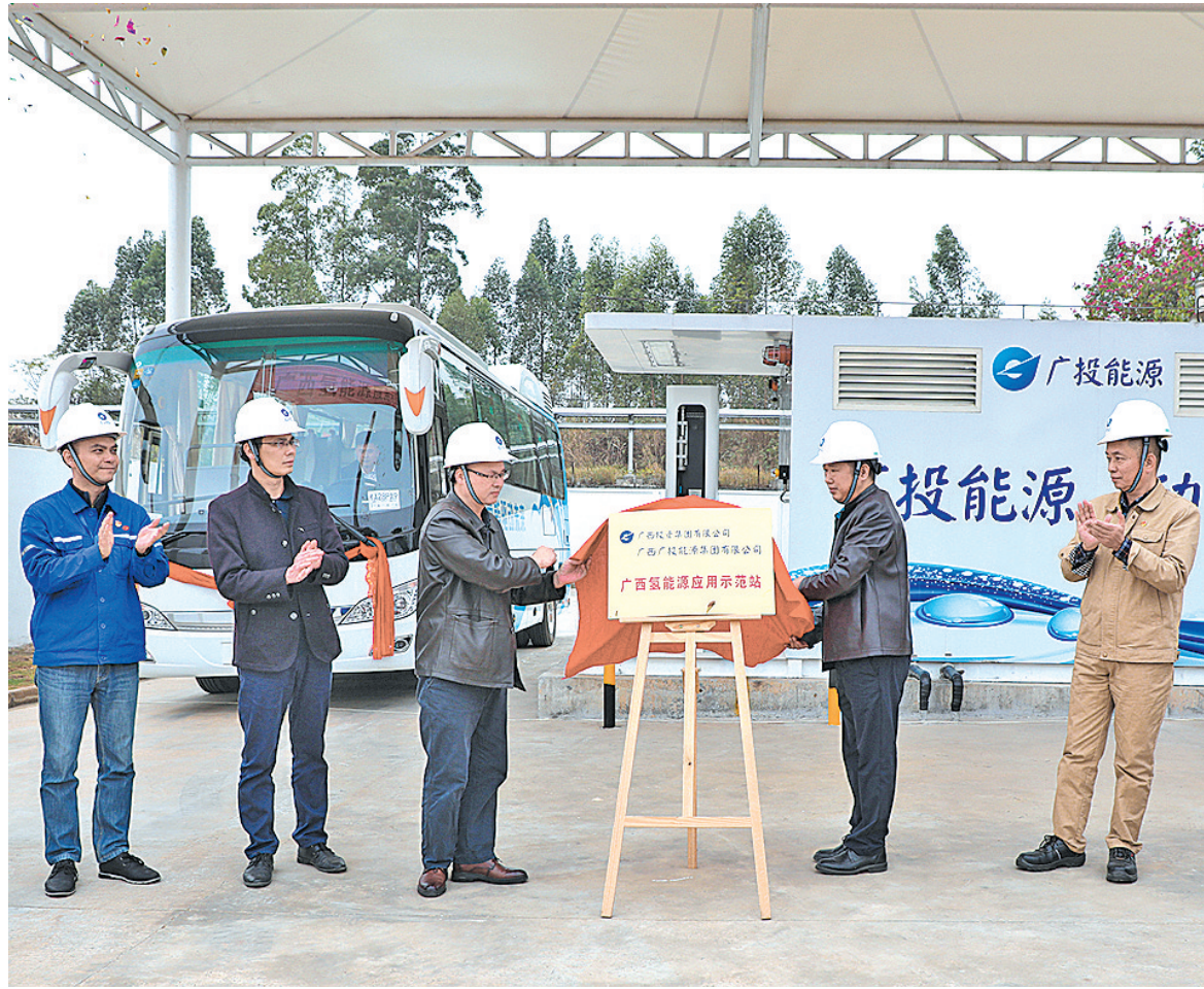
▲2019年12月31日,由广西广投能源有限公司投建的广西首个氢能示范站在我市竣工投运。

改革开放40多年,八桂大地风起云涌,各类企业蓬勃发展。作为已成立33年的国有自治区直属能源企业,广西投资集团来宾发电有限公司(简称“来宾发电”)和广西广投能源有限公司来宾电厂(简称“来宾电厂”),始终把企业发展与社会需求紧密结合,在改革浪潮中击楫勇进,有力支撑经济高速发展的同时,也实现了自身跨越式发展。