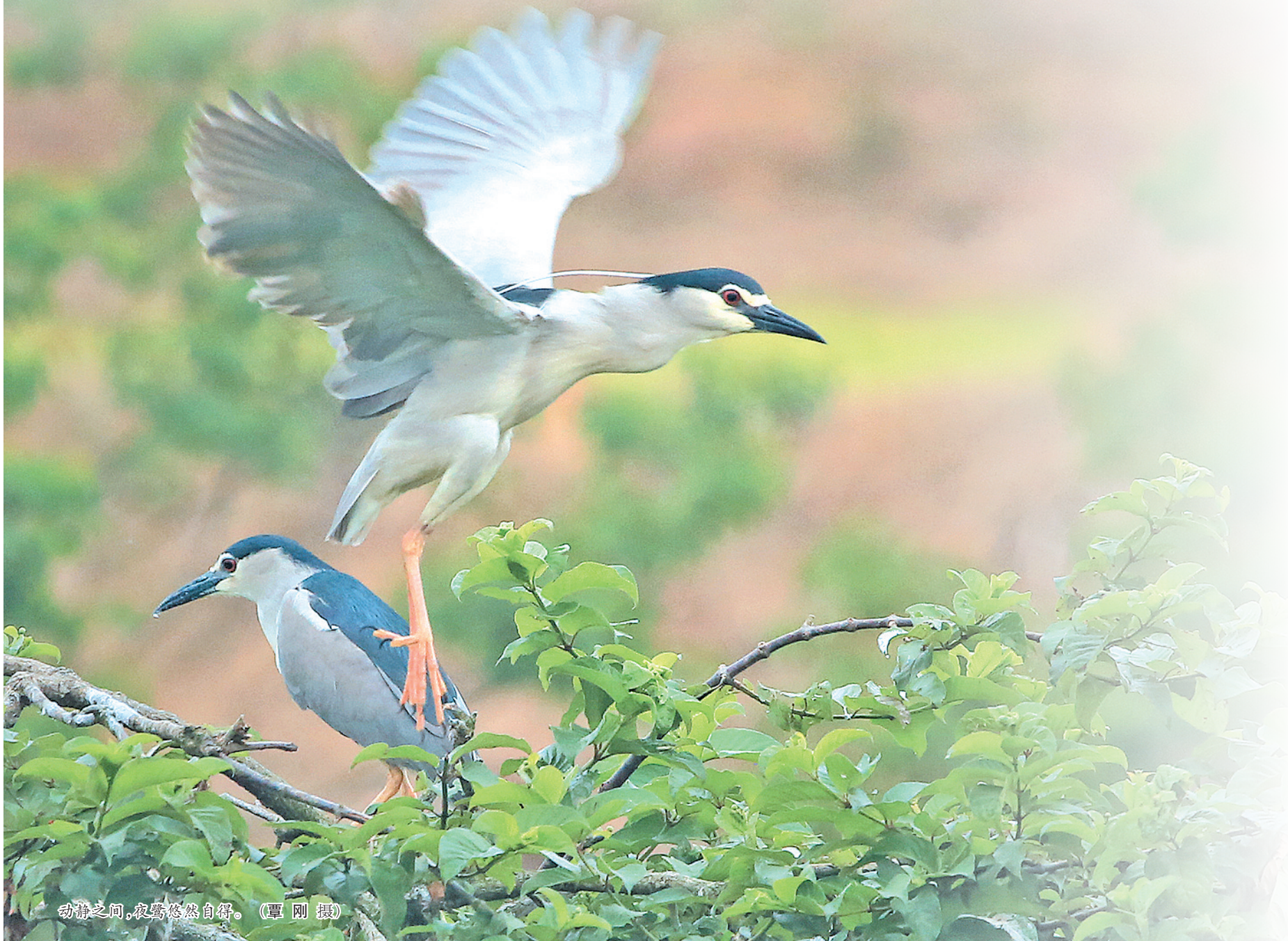
动静之间,夜鹭悠然自得。