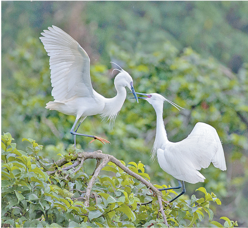
▲白鹭于枝头嬉戏打闹。