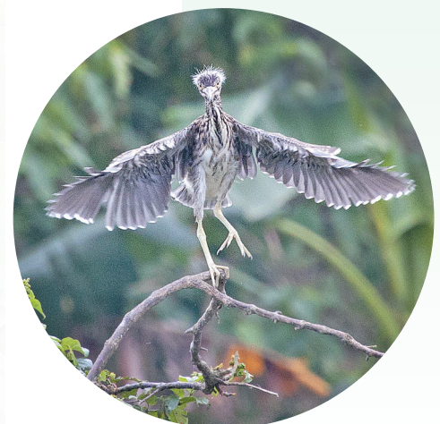
◀幼小的夜鹭欲展翅飞舞,惹人怜爱。