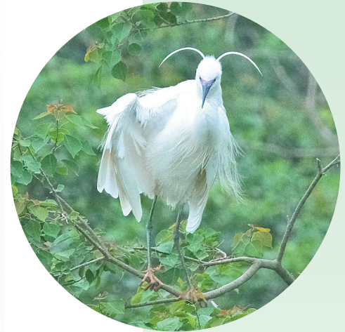
◀白鹭栖息枝头,让人看得心醉。