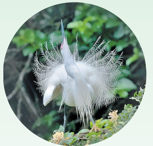
▶树枝上栖息的白鹭似开在微风中的一朵花。