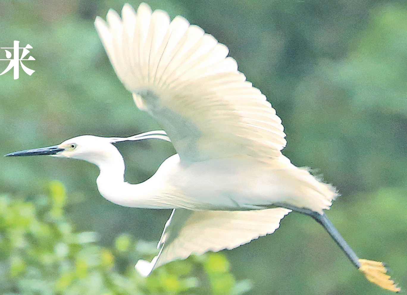
白鹭绿树,构成一幅美丽的画卷。

据了解,白鹭是国家二级保护动物,对生存环境要求很高,被称为“大气和水质状况的监测鸟”,是生态环境的晴雨表。白鹭选择到合山、象州和忻城栖息,正是来宾市近年来加大环境保护,呈现出良好生态环境的印证。