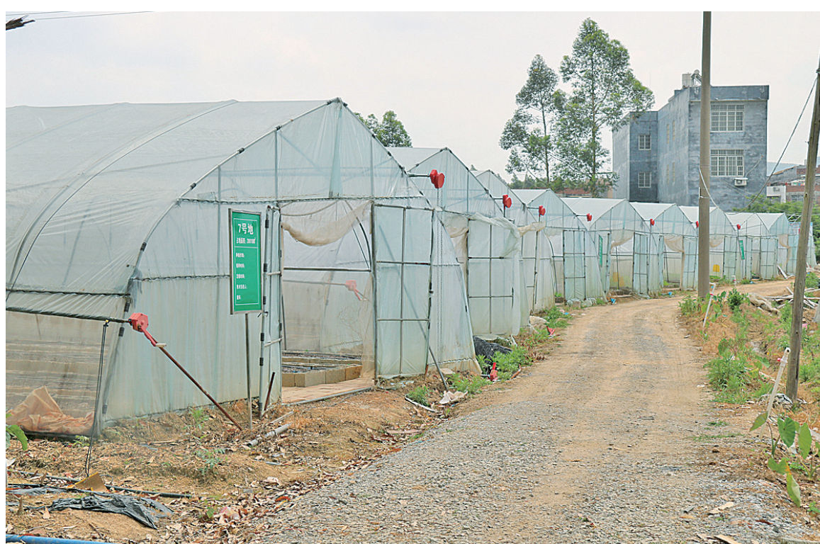
▲蔬菜大棚外景一角。