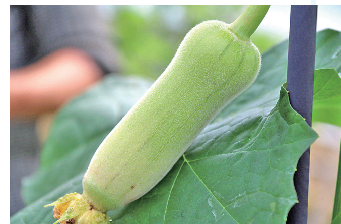
▲即将成熟的新品种丝瓜。