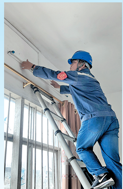
▲供电局工作人员正在眉山小学检修教室供电线路是否存在安全隐患。

武宣讯 5月9日，南方电网广西来宾武宣供电局志愿服务队到定点帮扶村武宣县二塘镇眉山小学，开展“党旗领航、爱心帮扶”新时代文明实践志愿服务活动。志愿服务队对眉山小学的供电线路进行检修和维护，更换存在安全隐患的线路开关；对校园全方位无死角进行消杀、搞好卫生清洁，并为学校师生免费捐赠一次性医用防护口罩300只。（李季）