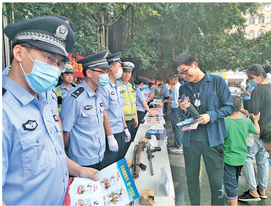
▲开放日当天,民警在迎宾广场向市民进行法制宣传,吸引了众多市民驻足观看。