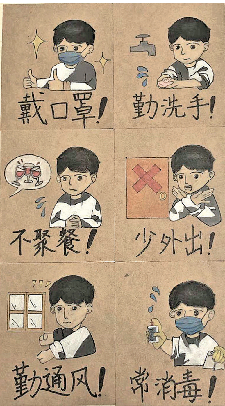
▲《防控病毒从我做起》(周家慧 作)