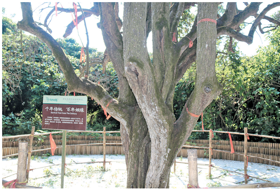
▲两颗杨桃树缠抱在一起生长千年,它们一同吸收天地灵气,诠释着忠贞的爱情。