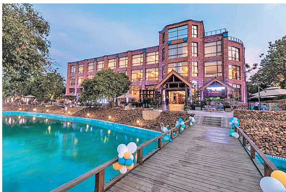
▲时光岛圣展度假酒店。