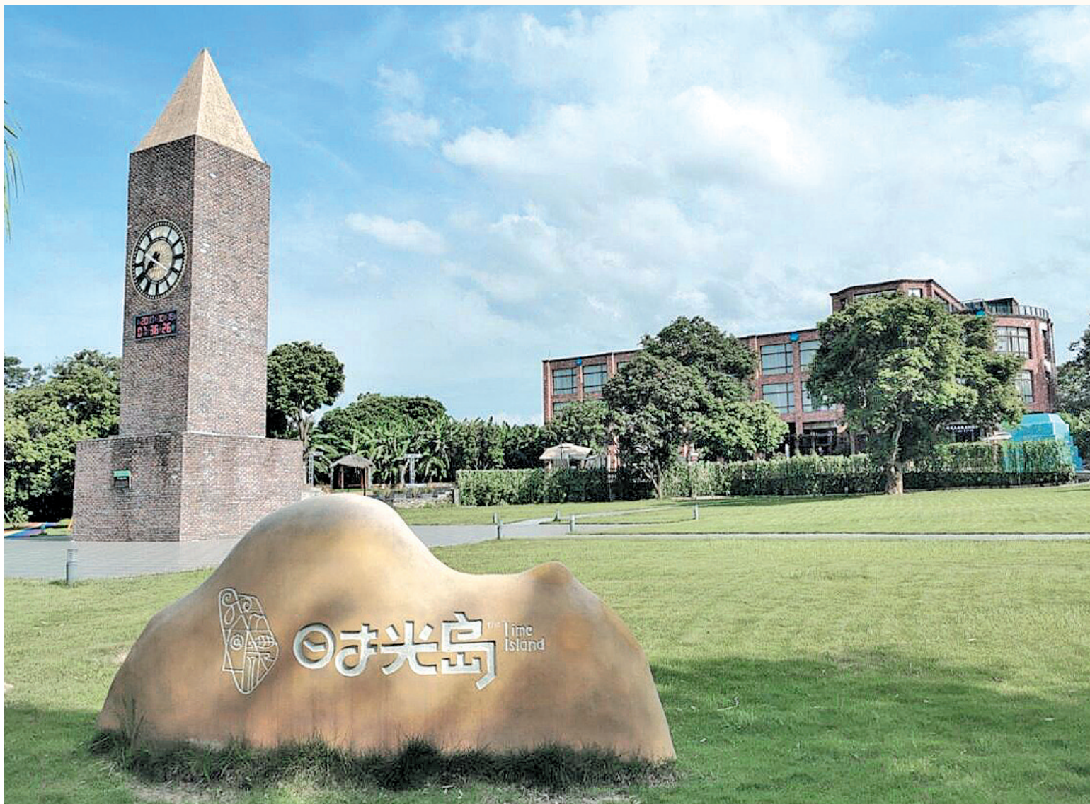
▲时光岛时光倒流钟广场。