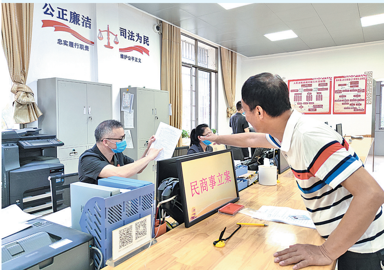
▲在服务中心,一名群众正在向工作人员咨询。

近年来,象州县人民法院通过扎实推进两个“一站式”建设,搭建“一体两翼”的涉诉矛盾纠纷预防化解网络,以“一站式多元解纷”“一站式诉讼服务”等措施,全面提升诉讼服务能力和水平,不断提升人民群众获得感、安全感和幸福感,成效显著。