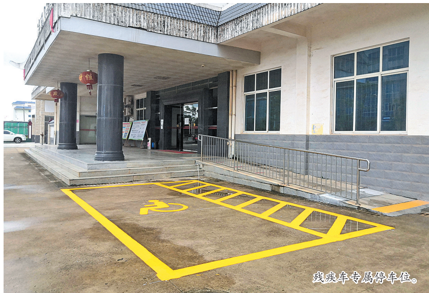
残疾人专属停车位。

另外,我市把无障碍信息交流建设纳入信息化建设规划。市政府网站设置无障碍浏览功能,市图书馆开设视力残疾人阅览室,提供盲文读物、有声读物;政府、银行等对外服务窗口为残疾