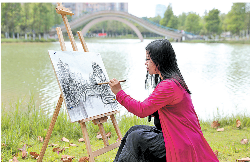
▲水城边写生。