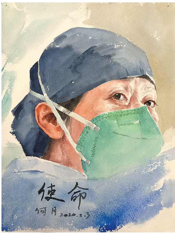
▲何月抗疫画作《使命》。