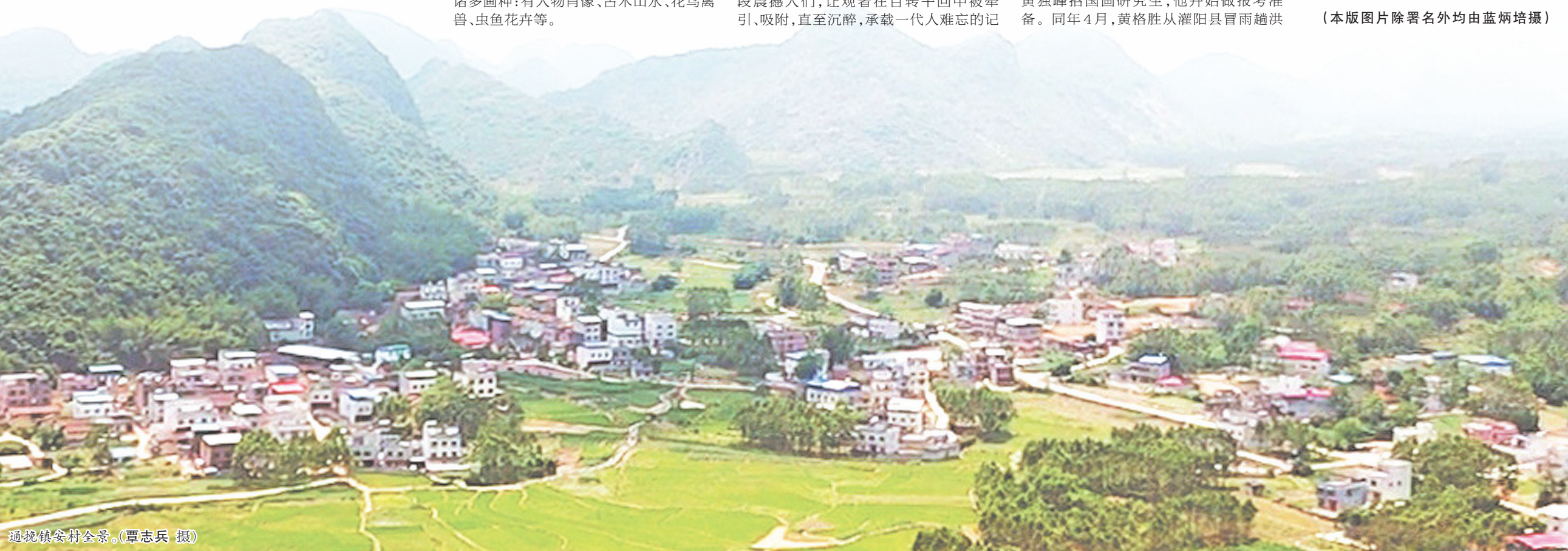
通挽镇安村全景。