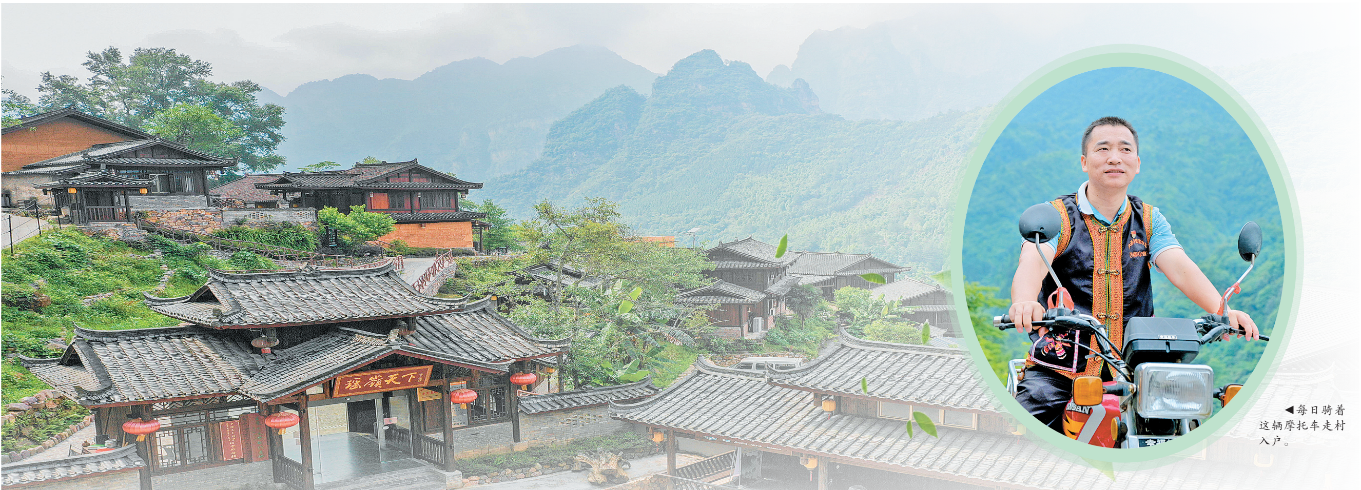
◀每日骑着这辆摩托车走村入户。