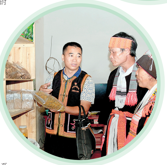
◀向贫困户宣传农产品包装和销售经验。