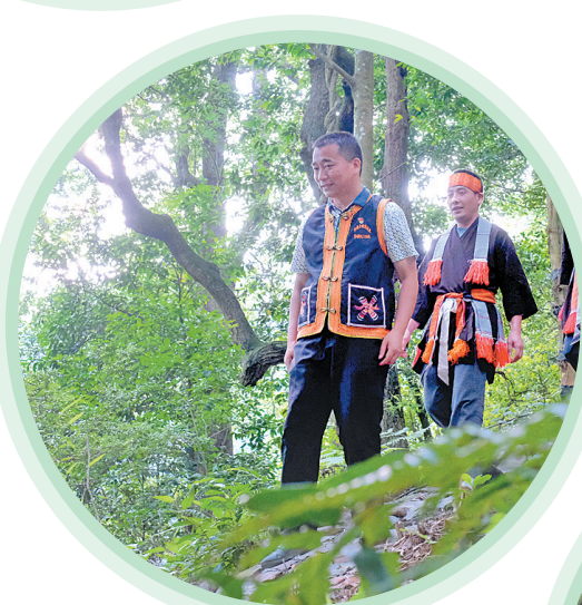
▲跋山涉水，走村入户。