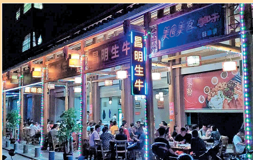
美食节活动火爆现场。