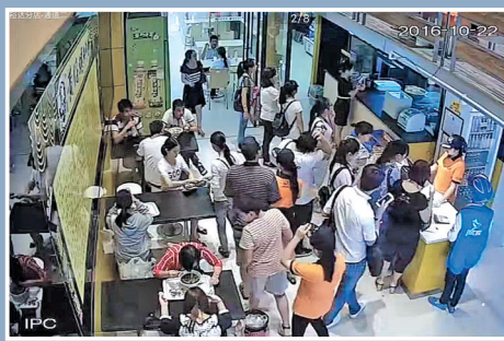
顾客在黄仔螺蛳粉店排队取餐。