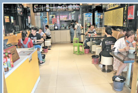
黄仔螺蛳粉店内环境。