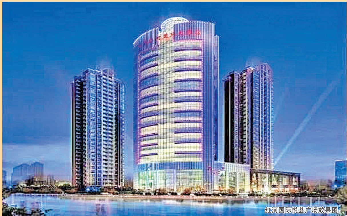
红河国际悦荟广场效果图。