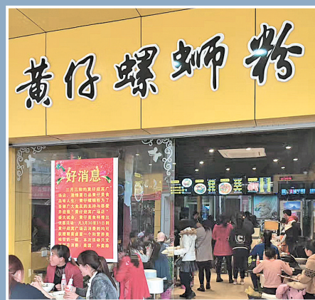
在黄仔螺蛳粉来宾迎宾广场店，很多顾客慕名而来。