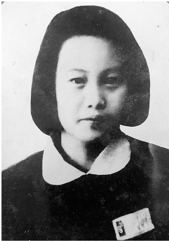
▲贺智华烈士。(资料图)

在去年庆祝新中国70华诞的日子里，眼前不断闪现华夏大好河山的一幅幅美丽画卷——一座座漂亮的国际化大都市，一列列奔驰的高铁，景色优美的城乡，让人无比振奋和自豪。无数仁人志士和普通劳动者用辛勤的汗水谱写出社会主义现代化建设的壮丽诗篇，成为推动中华民族伟大复兴的强大动力。在享受幸福生活和憧憬美好未来的时刻，那些曾经为革命胜利抛头颅、洒热血的英雄们也在脑海中鲜活起来，令人难以忘怀。被誉为壮乡“刘胡兰”的贺智华烈士的英雄事迹，尤其让我感动。