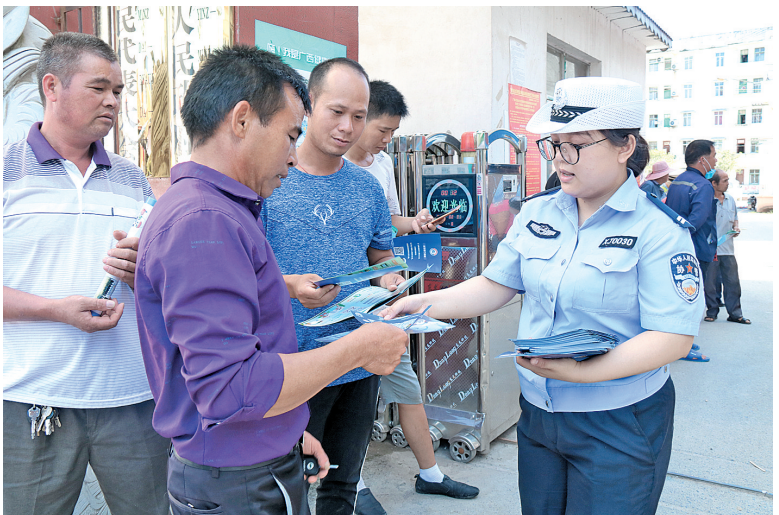
▲工作人员向群众分发宣传资料。