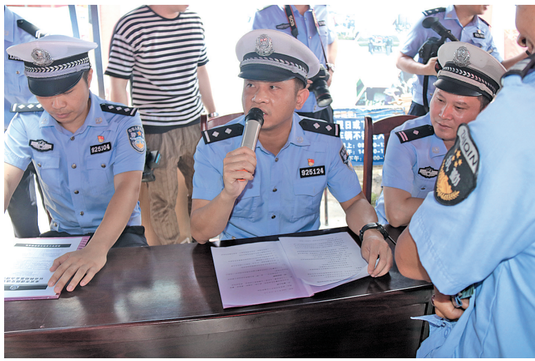
▲民警向群众介绍“一盔一带”安全守护行动的意义。