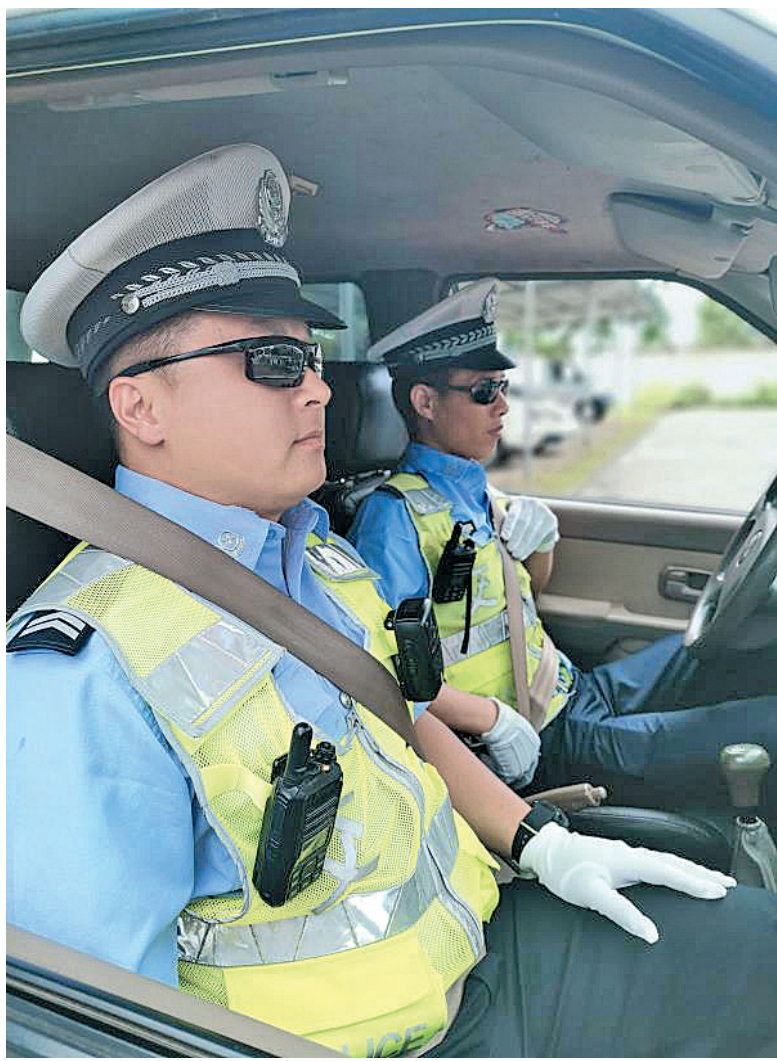
▲民警示范佩戴安全带。