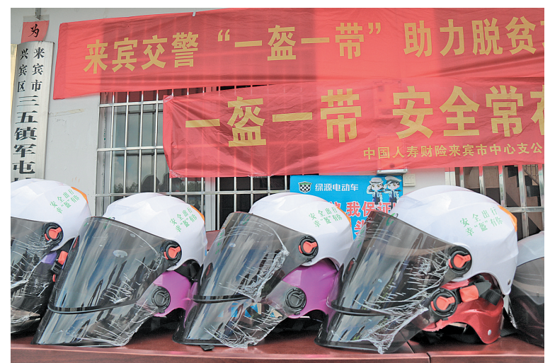
▲现场待赠送的头盔。