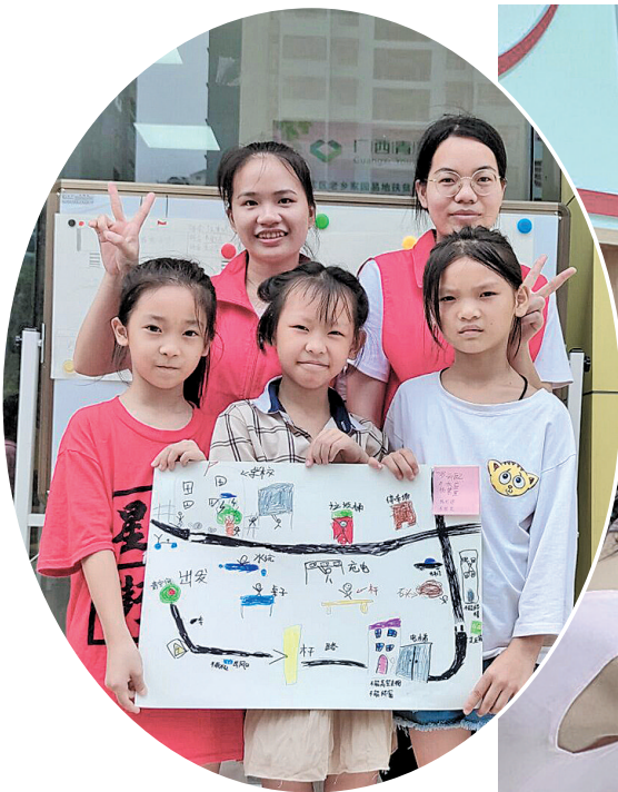
▲孩子们和志愿者展示共同完成的手绘“社区安全地图”。