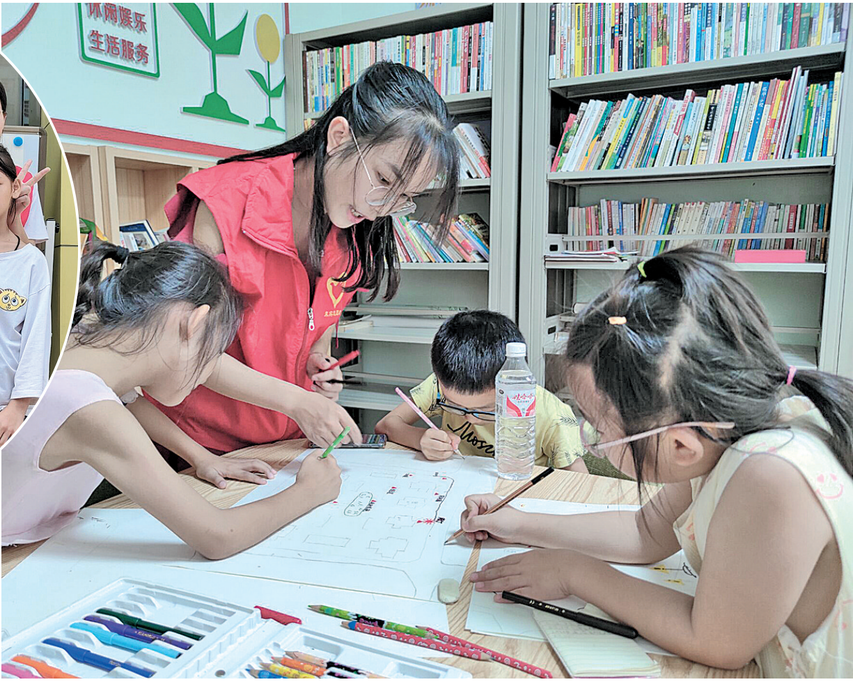
►志愿者引导孩子手绘“社区安全地图”。