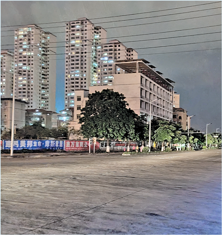
▲绿源路（盛源路—公园路段）路灯未亮。

晚刊讯近日，有网友在论坛上反映城区来华街道的绿源路、阳华路、星城路等路段的主干道路路灯发生损坏，给附近居民夜间出行带来不便，希望相关部门及时维修。