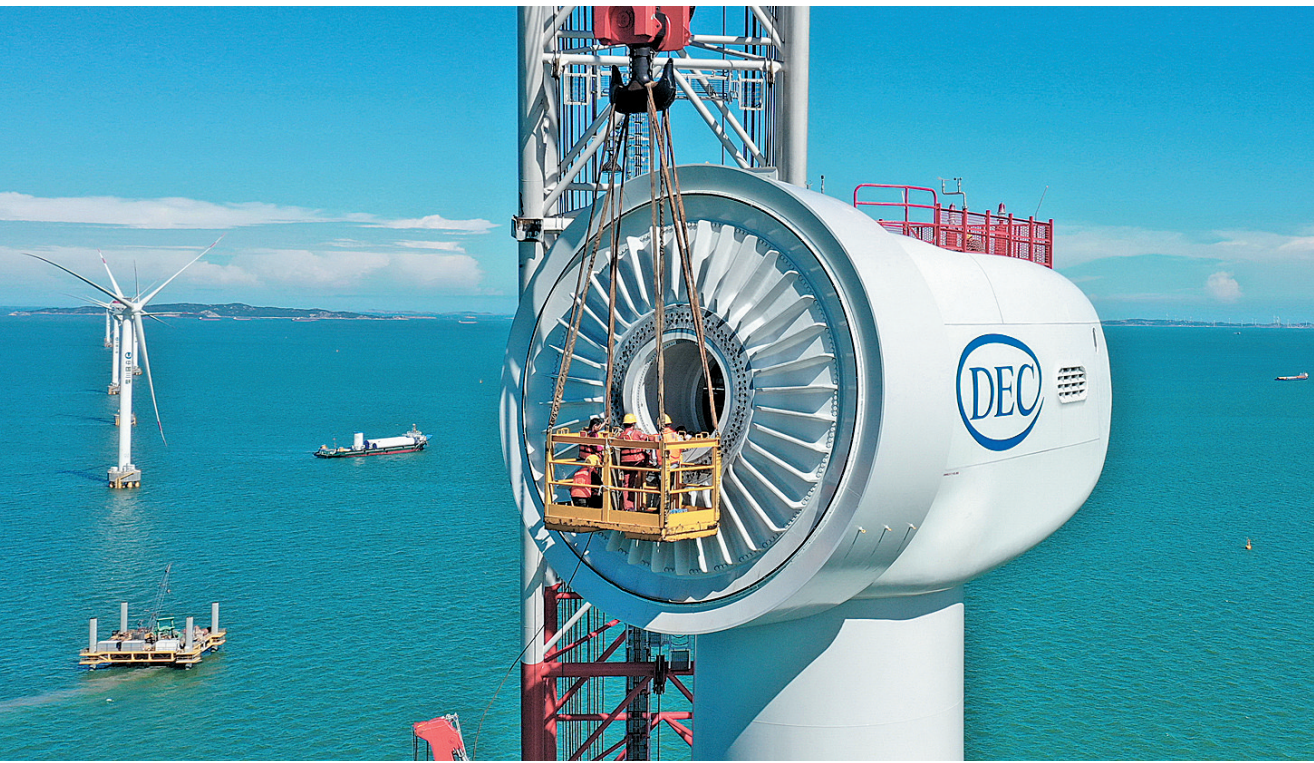
图为施工人员在福建福清兴化湾二期海上风电场10兆瓦海上风电机组安装现场忙碌(6月12日摄,无人机照片)。