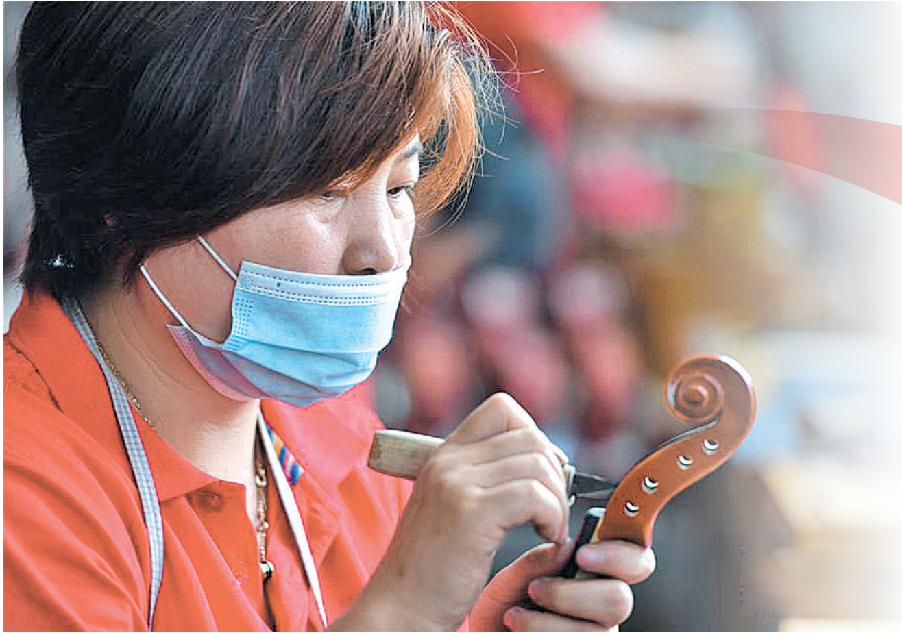
▲工人在河南驻马店市确山县提琴产业园提琴生产车间雕刻琴头。