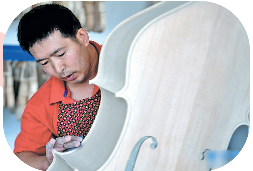
▲工人在河南驻马店市确山县提琴产业园提琴生产车间制作提琴。