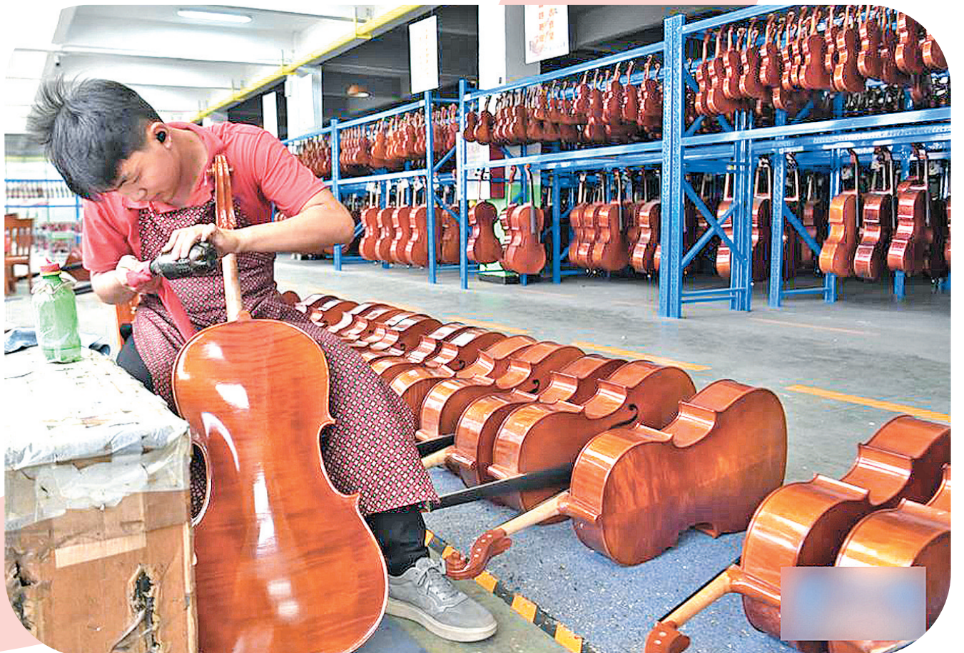
▲工人在河南驻马店市确山县提琴产业园提琴生产车间打磨琴头。