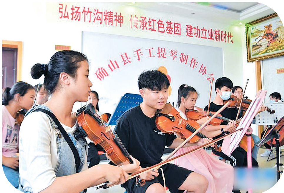
▲年轻人在河南驻马店市确山县手工提琴制作协会排练合奏曲目。