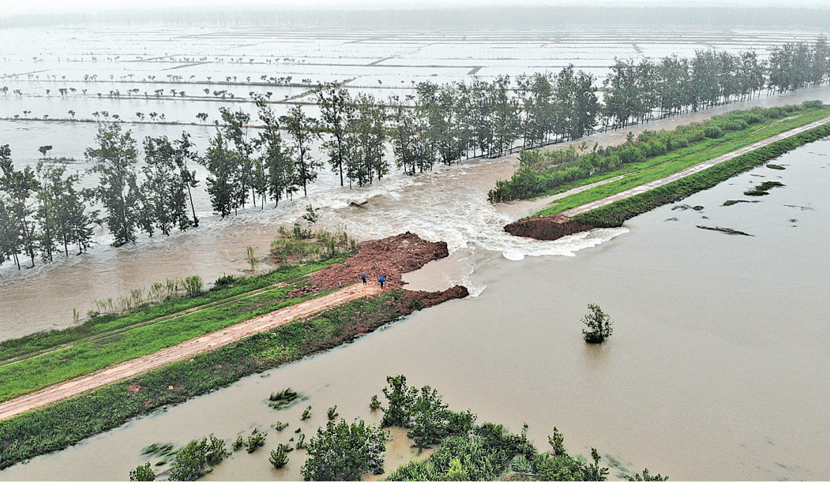
▲7月19日凌晨3时许,安徽滁河大堤破开两处缺口,浑黄的滁河水涌入堤内的荒草三圩和荒草三圩蓄滞洪区。这是继18日启用东大圩蓄滞洪区后,安徽又启用的两处蓄滞洪区。图为洪水通过荒草三圩突破口涌入蓄滞洪区内(无人机照片)。