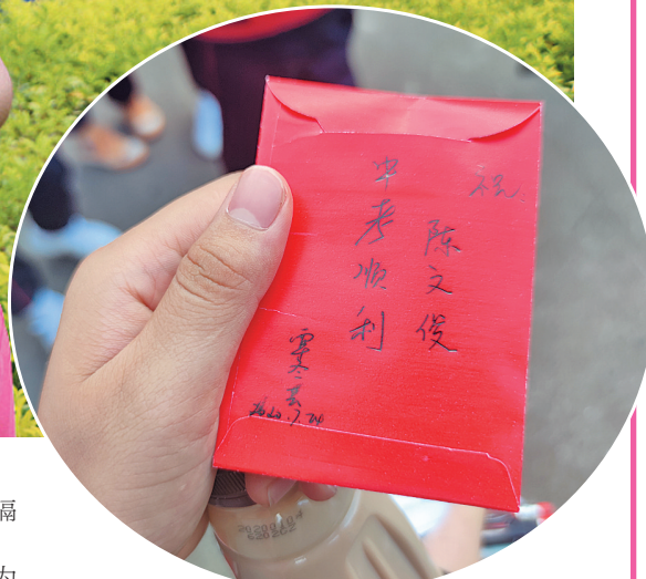
▲在民族中学,考生在考前领到老师的祝福红包。