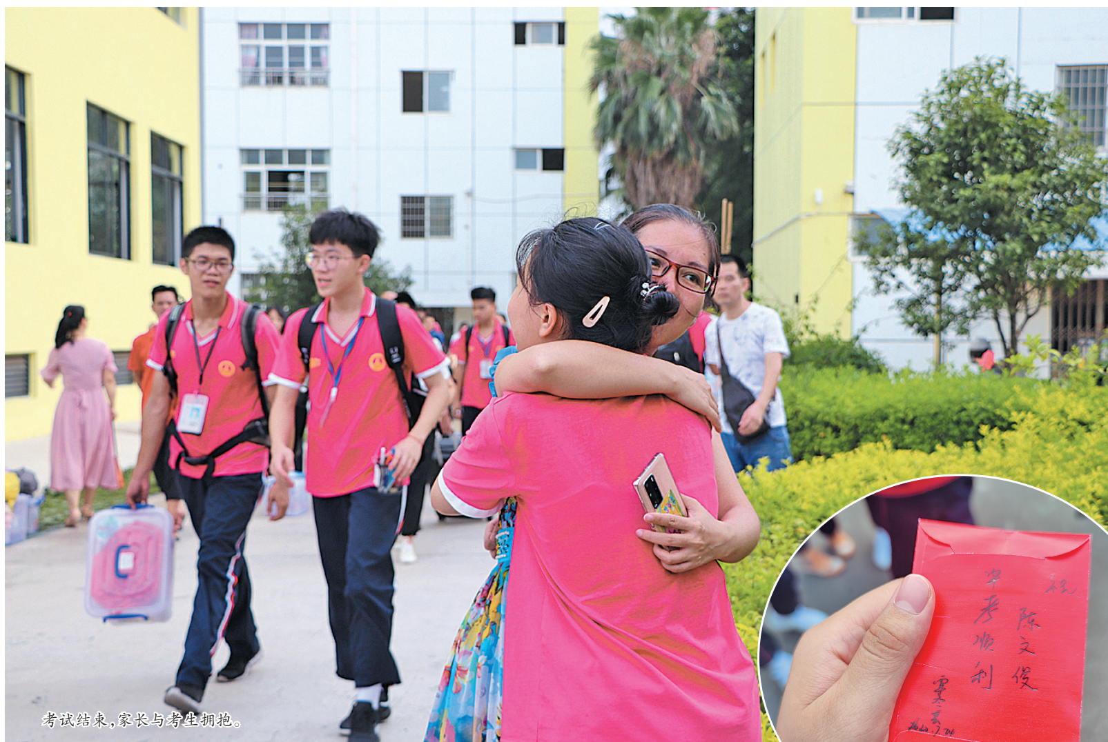
考试结束,家长与考生拥抱。

7月24-26日是来宾初三学子参加中考的日子。期间,本报记者兵分三路,守候在来宾各考点,记录这场特殊的中考。