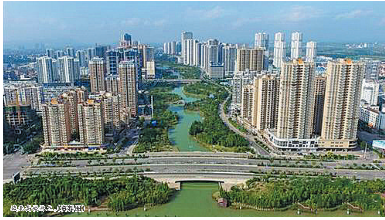
城北高楼林立。(资料图)

以下数据均由各房开提供,如有发现与实际不符可拨打爆料热线:0772-6655168(一经采用可获得爆料费)