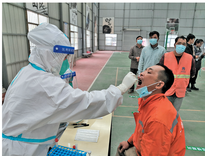
▲医务人员为工人检测核酸。

“为辖区企业提供上门核酸检测服务,是我们应该做的。”忻城县人民医院院长罗伟告诉记者,企业为地方发展作出积极贡献,作为医疗机构,应该主动为他们提供服务。“检测结果出来后,我们会送到企业相关负责人手里,为工人回家提供方便。”罗伟说。接下来,该院将继续为辖区内的企业提供上门服务。