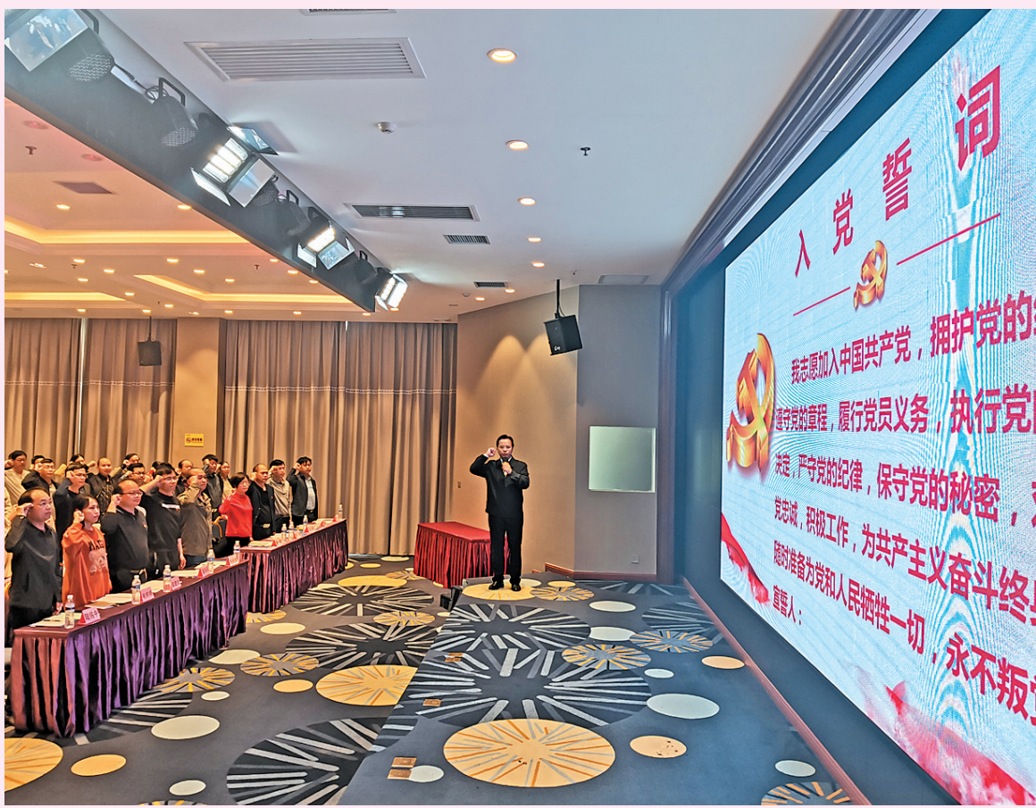
▲重温入党誓词、歌唱红歌……昨日,2021年来宾市教育体育系统党组织书记和党务干部基层党建业务综合素质能力提升暨党史学习教育专题培训班开班,近160名中小学基层党组织书记和党务干部高唱红歌,唱出心中对党的热爱。此次培训旨在增强基层党建的感染力、吸引力、凝聚力和战斗力,全面提升全市中小学校基层党组织书记和党务干部的基层党建业务综合素质能力,推动教育体育事业高质量发展。图为党组织书记和党务干部重温入党誓词。