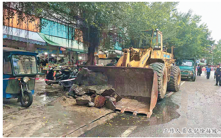
工作人员在拆除接坡。

晚刊讯(记者 曹沙 通讯员 莫世会 文/图)为防止违章建筑死灰复燃,4月25日起,兴宾区城市管理规划建设执法监察大队联合市公安局交警支队、兴宾区城东南街道办事处等多个部门单位,对城东南三路至西南三路、东二路等路段私设水泥步基、污水堆积污染路面等“脏乱差”现象进行整治。