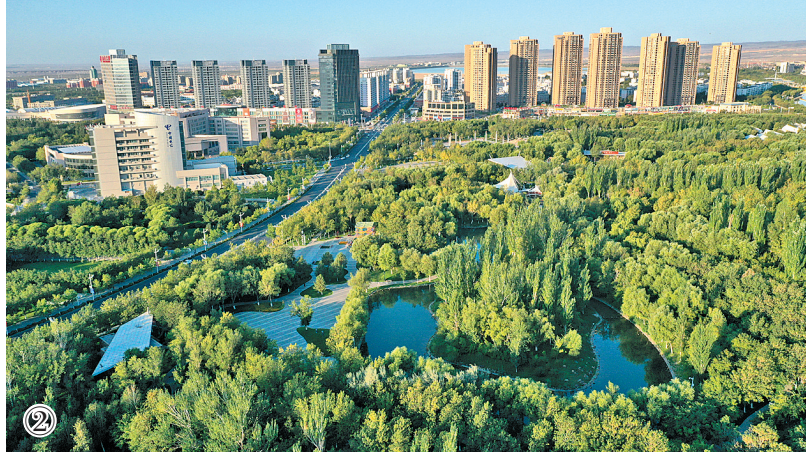
图1:1958年国庆节,横穿塔克拉玛干沙漠的石油地质队在沙漠举行升国旗仪式。图2:克拉玛依市新貌。

“当年我赶着马群寻找草地,到这里勒住马我瞭望过你,茫茫的戈壁像无边的火海,我赶紧转过脸,向别处走去,你没有草没有水连鸟儿也不飞,你没有歌声没有鲜花没有人迹……”这首曾在大江南北广为传唱的《克拉玛依之歌》,反映了克拉玛依昔日的荒凉和建设者创业戈壁滩的艰苦历程。