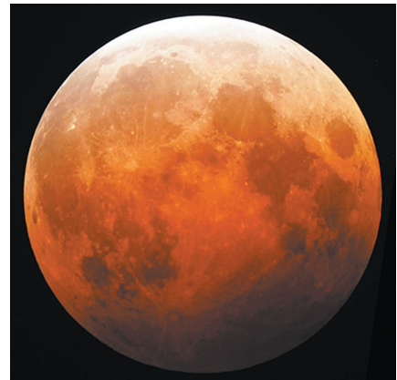
▲月全食过程中的“红月亮”。