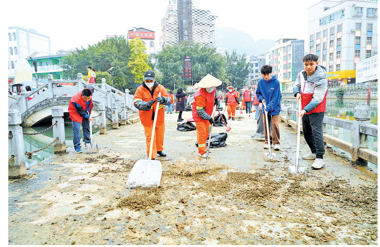
▲志愿者与环卫工人一起清理河道淤泥。