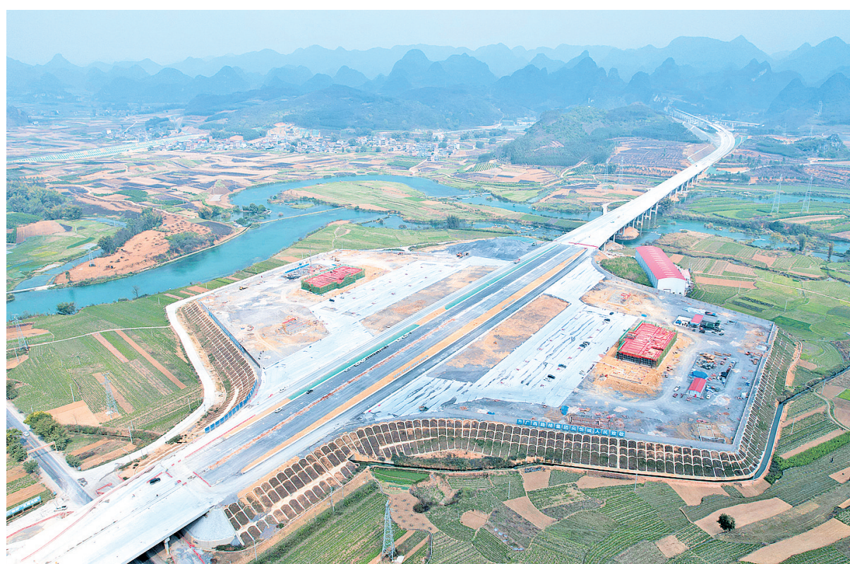
▲3月7日,笔者在来都高速公路忻城服务区建设现场看到,服务区开始建设综合楼等基础设施。忻城服务区位于忻城县城关镇江信村清水河附近,总用地面积98亩,总建筑面积6154㎡,左右两侧各设有1栋3层综合楼、1个加油站、1个修理车间、1个变电所及埋地式箱泵一体化设备、污水处理池、水塔等配套设施。图为3月7日航拍图。

据了解,全段红水河特大桥是来都高速公路七隆八桥一枢纽关键控制性工程之一,系贺州至巴马高速公路上第一座中承式双幅钢管拱混凝土拱桥,总桥长438.25米,该桥桥址东岸位于忻城县境内,西岸位于南宁市马山县境内。