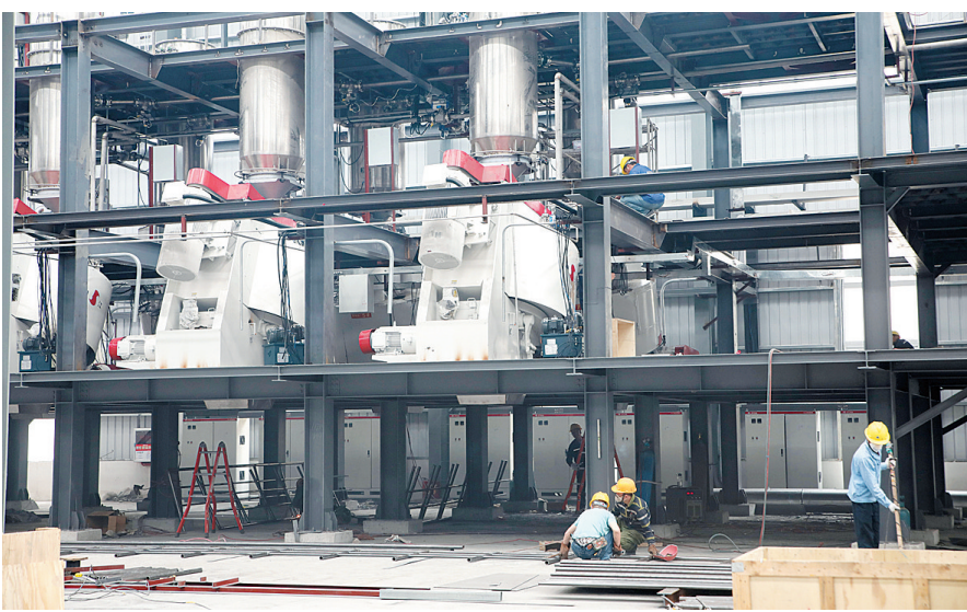
▲广西海螺环境科技公司工人正在忙碌的安装机器设备,争取早日投产使用。

园区组建“联盟服务队”,坚持做到“企业有所需、党员必有应”。积极打造服务企业升级版,由“4+”升级为“6+”,即推行“联系市领导+市直单位+园区