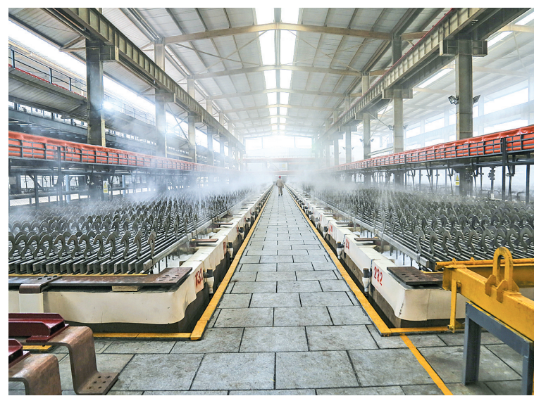
▲为满足客户订单需求,广西汇元锰业有限责任公司引进高度自动化、智能化生产设备。图为3月17日,生产车间里一派繁忙的景象。

园区推行“项目+人才”工作模式,通过引进产业项目带动引进高层次人才,带动引进产业项目。目前,园区共有高新技术企业35家,集聚创新创业人才2.2万人。通过人才引领传统产业转型升级和新兴产业发展壮大,走出一条具有园区特色的高质量发展之路。