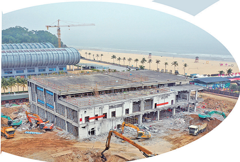
施工中的广东省水下文化遗产保护中心。

广东海丝馆也将进一步培养引进水下考古研究领军人才,推动挂牌成立中国水下考古活化利用研究院,牵头成立国际沉船博物馆协会,开展文物展览、学术、人才等交流和培训活动,不断提升学术影响力,打造世界级水下考古研究中心。