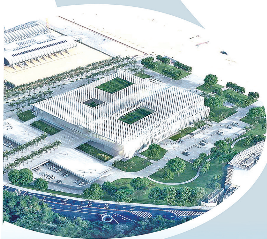
广东省水下文化遗产保护中心鸟瞰(效果图)。