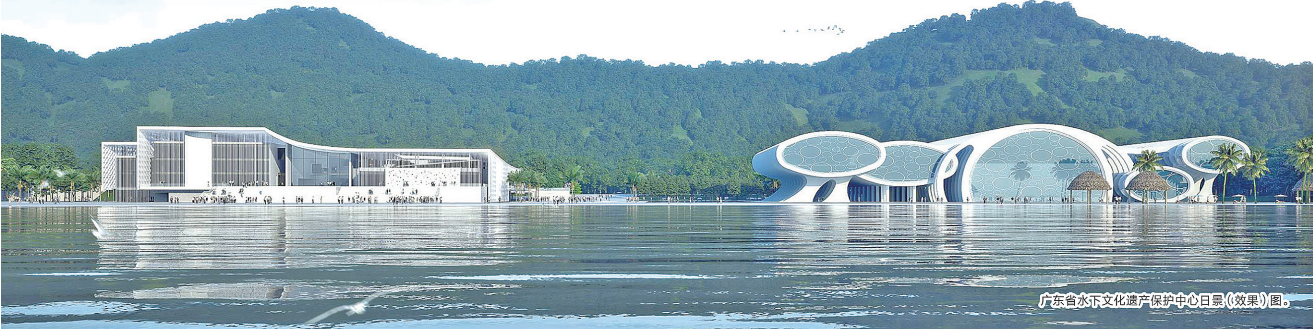
广东省水下文化遗产保护中心日景(效果图)。