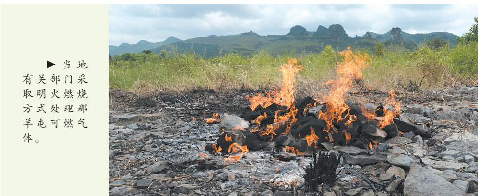
▶当地有关部门采取明火燃烧方式处理那羊屯可燃气体。

晚刊讯(记者刘维杨晓华通讯员廖松文/图)近日,在合山市北泗镇东亭村那羊屯村附近的一块荒地,突然冒出的刺鼻臭味,让住在附近的居民苦不堪言。8月5日,为探究究竟,记者来到那羊屯。