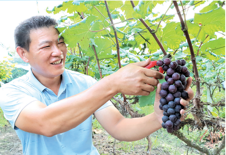
葡萄丰收果农乐开怀。