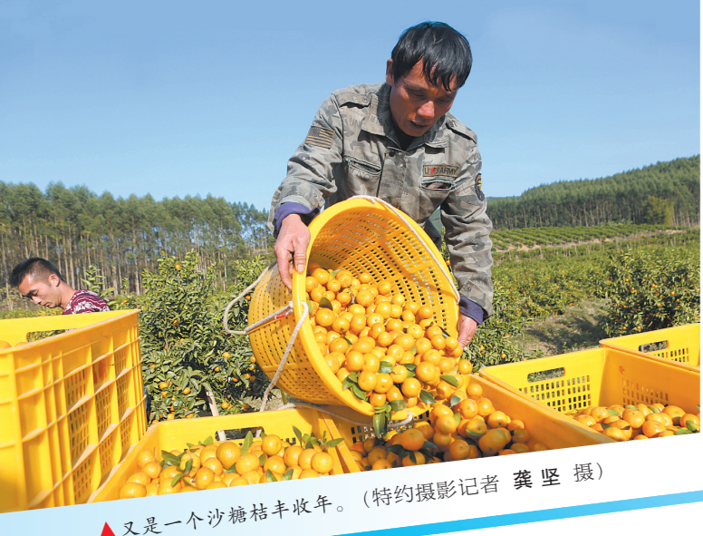
又是一个砂糖桔丰收年。

十年来,象州县坚持农业稳县战略,不断优化农业产业结构,在优质稻、甘蔗、禽畜等产业基础上,按照“稳粮、保桑、优果、强林、扩蔗”的思路,调整为优质稻、甘蔗、桑蚕、水果、林木等特色产品,多措并举促进特色产业发展。 民以食为天,食以粮为先。象州县历来盛产优质水稻,有着“桂中粮仓”的美誉。一直以来,该县把粮食安全生产作为首要工作来抓。党的十八大以来,该县完成25万亩粮食生产功能区划定工作,完成41.4万亩高标准农田建设,推广机械化育秧、插秧、收割,降低生产成本,助力增收。目前全县主要农作物耕种收综合机械化率达74.24%。推广水稻良种种植、大豆玉米带状复合种植,提高土地产出率,全县粮食种植面积和总产量保持在45万亩、16万吨以上。近年来,象州县先后获评“中国好粮油”示范县、重点县,全国农村承包地确权登记颁证工作先进集体,获评来宾市第十批文明单位、产业发展先进集体及建市15周年经济社会发展先进集体。 糖料蔗产业是象州县重要的支柱产业,是农村家庭收入的主要来源之一。党的十八大以来,象州县推行糖业订单合同,高标准完成糖料蔗生产保护区21.14万亩划定,11.66万亩“双高”糖料蔗基地建设任务,完成7900亩“双高”基地水利化建设,获得自治区质监局发文批准创建“自治