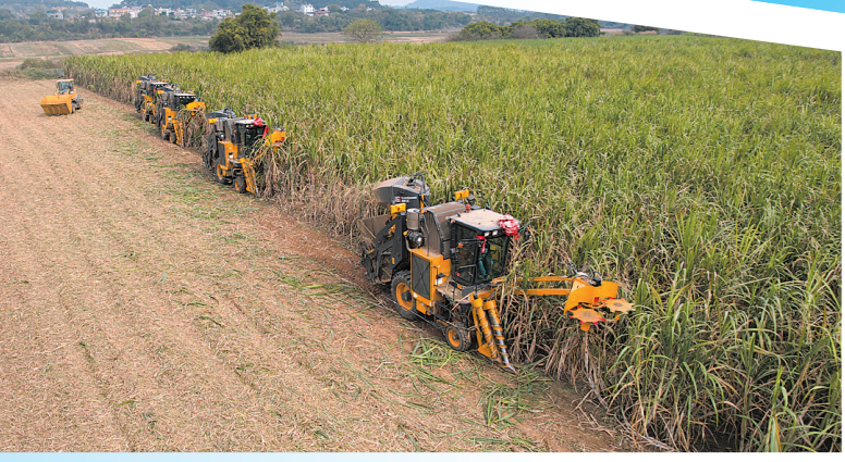
甘蔗机械化收获省时省力。

三江口森林工业城的广西正龙木业有限责任公司生产车间,工人们在流水线上忙着生产家具板材。经推板、修芯、冷压、贴面等30多道工序,一块块整洁的家具板源源不断地生产出来。仓库里,一辆叉车正把家具板材成品装上大货车,即将通过柳州高速公路发往广州。 三年前,三江口森林工业城所在地还是一片低产值的旱地。2019年7月,象州县和北京驰普投资集团来宾驰普公司携手共同打造,象州首个林业产业园在这里诞生。全国各地的木材精深加工企业及上下游产业链相关企业在此集结,主打产品为木地板基材、建筑模板、高端家具基材、全屋定制等。经过三年的发展,三江口森林工业城签约企业入驻18家,其中12家已投产,2家在建,预计今年产值达30亿元,直接提供2500个就业岗位,税收超0.7亿元。 三江口森林工业城的发展壮大,可以说是十年来象州工业踔厉奋发勇毅前行,高质量发展的缩影。 党的十八大以来,象州县秉持“三企入桂”东风,围绕“东融”、粤港澳大湾区建设等国家战略,坚持以资源换产业,全面承接东部产业转移,先后引进三江口节能环保产业园、三江口新能源电动车产业园、锦江象州东融绿色建材产业园等超百亿元工业项目,形成丝绸纺织染整、绿色碳循环、新能源汽车零部件制造等特色产业集群。目前,园区建设有序推进,产业项目遍地开花,亿元以上项目32个,百亿元以上项目2个,其中华润、雅居乐、中航、杭州锦江、江苏合等7家企业为世界500强和中国民企500强。“十三五”期间,实现到位资金320.2亿元,实际利用外资5423万美元。 同时,象州县还大力发展新兴产业。近年来,该县丰收水库光伏发电、中航风电、华润风电等一批新能源发电项目并网发电,年产值达1.72亿元。家得宝、华置、港置环保餐具等一批环保餐具项目建成投产,产品远销欧美发达国家,年产值达1亿元。全县新能源、新材料、节能环保产业链逐步延伸,战略性新兴产业项目达9个,总投资32亿元。 象州工业发展的十年,也是项目建设大干快上的十年。十年来,象州县统筹推进自治区级重大项目43个,市级重大项目363个。仅2020年至2022年,全县列入“五网”建设三年大会战项目就达57个,截至目前累计完成投资超百亿元。目前,全县重点推进工业项目42个,总投资达570亿元,“双百双新”产业项目6个,规模以上工业企业62家,2022上半年规模以上工业总产值同比增长5.4%。 十年奋力拼搏,十年春华秋实。十年来,象州县规模以上工业平均增长5.5%,固定资产投资年均增长17.9%,连续五年实现两位数高速增长。2021年,象州县地区生产总值104亿元,年均增长6.4%,比2011年翻了1.37倍。