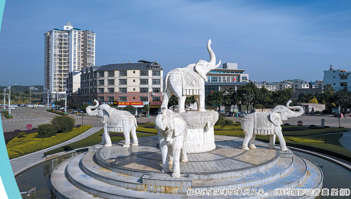
象州县易地扶贫搬迁安置点。

党的十八大以来,象州县在打赢脱贫攻坚战号角声中砥砺前行,始终坚持以脱贫攻坚为主线,紧盯“两不愁三保障”目标任务,实行“挂牌作战”,攻坚克难,如期夺取了脱贫攻坚的全面胜利,书写了与全国一道如期全面建成小康社会的精彩篇章。 好日子的背后,是持续不懈的努力。象州县组建了122支驻村帮扶工作队,选派293名工作队队员,安排137个后盾单位5436名结对帮扶责任人助力脱贫攻坚,全力打好基础设施建设、易地扶贫搬迁、产业扶贫、教育医疗住房“三保障”“四场硬仗”。最终实现了33个贫困村全部摘帽,3.37万贫困人口脱贫,历史性解决了绝对贫困问题。 围绕产业发展,象州县因地制宜精准施策,推广县级“5+2”、村级“3+1”特色产业,全县产业覆盖率达96.96%。累计投入资金11480多万元以奖代补资金对“5+2”等产业进行扶持。2016年以来,共开展种养技术培训330期,培训贫困群众2.4万多人次。2018年,象州县彻底消灭了集体经营性收入“空壳村”,122个村(社区)均实现村级集体收入2万元以上,2019年所有行政村集体经济收入全部达到4万元以上。 “十三五”期间,象州县完成饮水安全项目146个,“有饮水安全”达标率100%;完成14035户危房改造,拨付资金25286.67万元,惠及人数超5万人;完成133条村屯道路硬化,全县11个乡镇全部通等级公路,111个建制村全部通水泥路;筹集资金投入达4.95亿元,完成50个村级公共服务中心示范项目基础设施建设,涉及全县11个乡镇。 2016年至今,象州县完成易地扶贫搬迁安置527户,就业516户,实现“搬得出、留得住、能致富”。到2019年底,象州县已实现100%行政村光纤、100%行政村通4G通信网络,完成93%以上自然村实现光纤网络覆盖。九年义务教育巩固率从2015年的90%提升到100.66%。全县111所政府办村卫生室配齐“村医通”,村民在家门口即可享受医保报销政策。 十年来,象州县按照自治区的安排部署,整合资源、资金,千群合力持续开展“清洁乡村、生态乡村、宜居乡村、幸福乡村”行动。结合脱贫攻坚行动,实施乡村道路硬化、村庄绿化、亮化工程,解决了污水、垃圾处理难题。强力拆违治乱,大力推进农村“厕所革命”,实施改厕改建项目2.2万户、危房改造2512户,农村脏乱差的面貌得以改善。三里村获评全国乡村治理示范村,古朴村、纳楼村获评中国少数民族特色村寨,22个村获评市级“美丽乡村”综合示范村。 十年来,象州县如期实现了打赢脱贫攻坚战。截至2020年底,全县累计减贫11598户42609人,出列贫困村33个,综合贫困发生率从2014年底的10.3%下降为0。2020年,象州县荣获自治区扶贫开发工作考核一等奖。