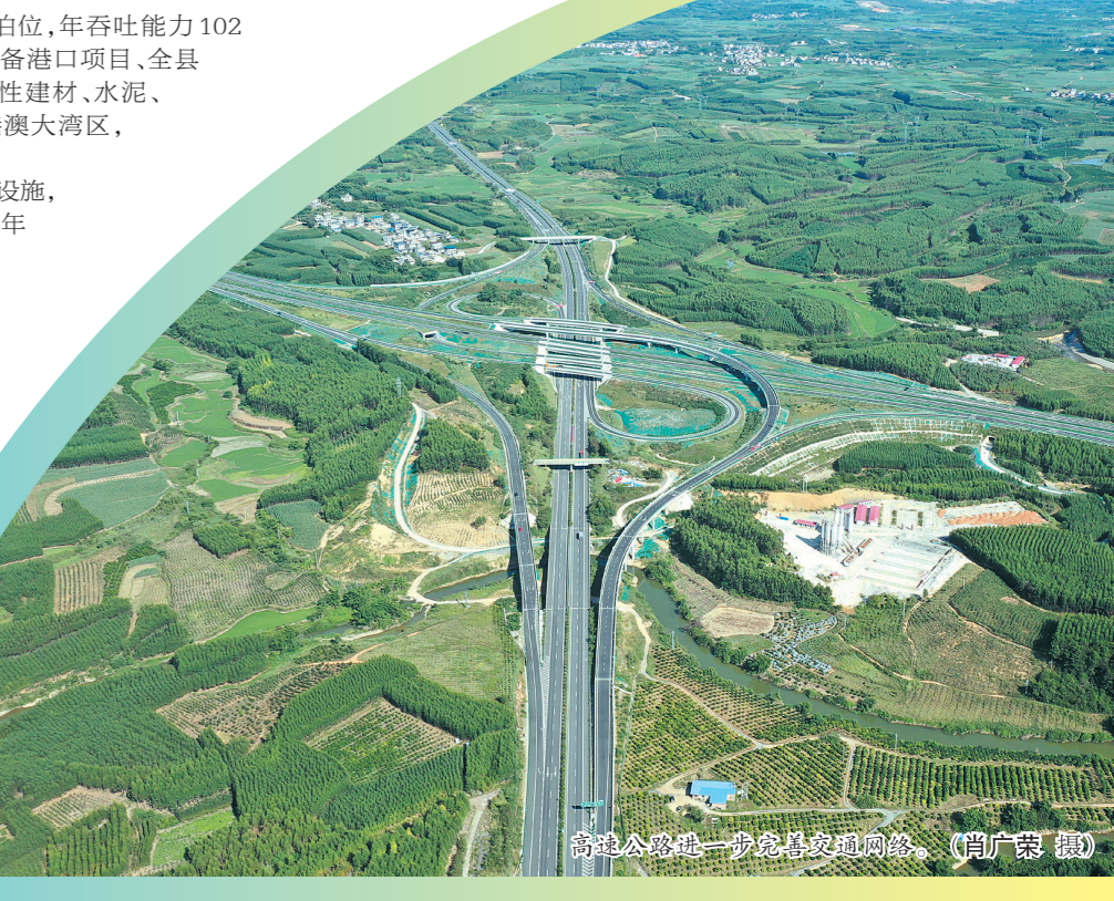
象州人盼望已久的龙圩大桥。

进城有两座大桥,出行可从六个出入口上高速,象州港区猛山作业区货运可直达珠三角……十年前,属于老、少、山、穷县的象州人民,曾经不敢想象,现在出行却是如此便捷。 “发展快,高速带。”2015年建成通车的柳州高速公路穿过象州境内,象州高速公路实现了“零”的突破;2017年,柳梧高速公路建成通车;贺巴高速(蒙山至象州段)2021年12月建成通车,贺巴高速(象州至来宾段)预计今年12月份部分通车。四通八达的交通路网,打通了“大动脉”,让流通速度更快,吸引了更多客商到象州投资兴业,有力推进了象州“港产城一体化”发展进程。象州县的高桥水稻、柑橘、甘蔗等农产品通过快速通道上送柳州、下至梧州和粤港澳,为象州县的经济发展按下了“快进键”。 十年来,象州县实施“通达工程和通畅工程,全县道路交通环境得到极大改善。目前,象州县境内路网结构由以前的“一纵一横”向“三纵四横”拓展,象州县境内乡级全部通二、三级水泥(沥青)硬化路,111个行政村全部通四级及以上水泥(沥青)硬化路,拥有贯穿象州县境内的国道省道共4条(国道2条、省道2条),总里程181.787公里。2021年全县有营运车辆478辆,其中营运货车277辆,营运客车201辆(客运汽车168辆,出租汽车16辆,公交车17辆),全县乡镇通车率100%,建制村通客车率100%。 十年来,象州县港口码头建设快速发展,建成了桩柱式码头来宾象州