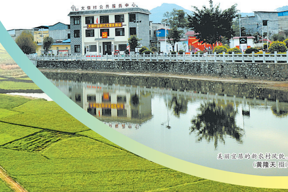
美丽宜居的新农村风貌。