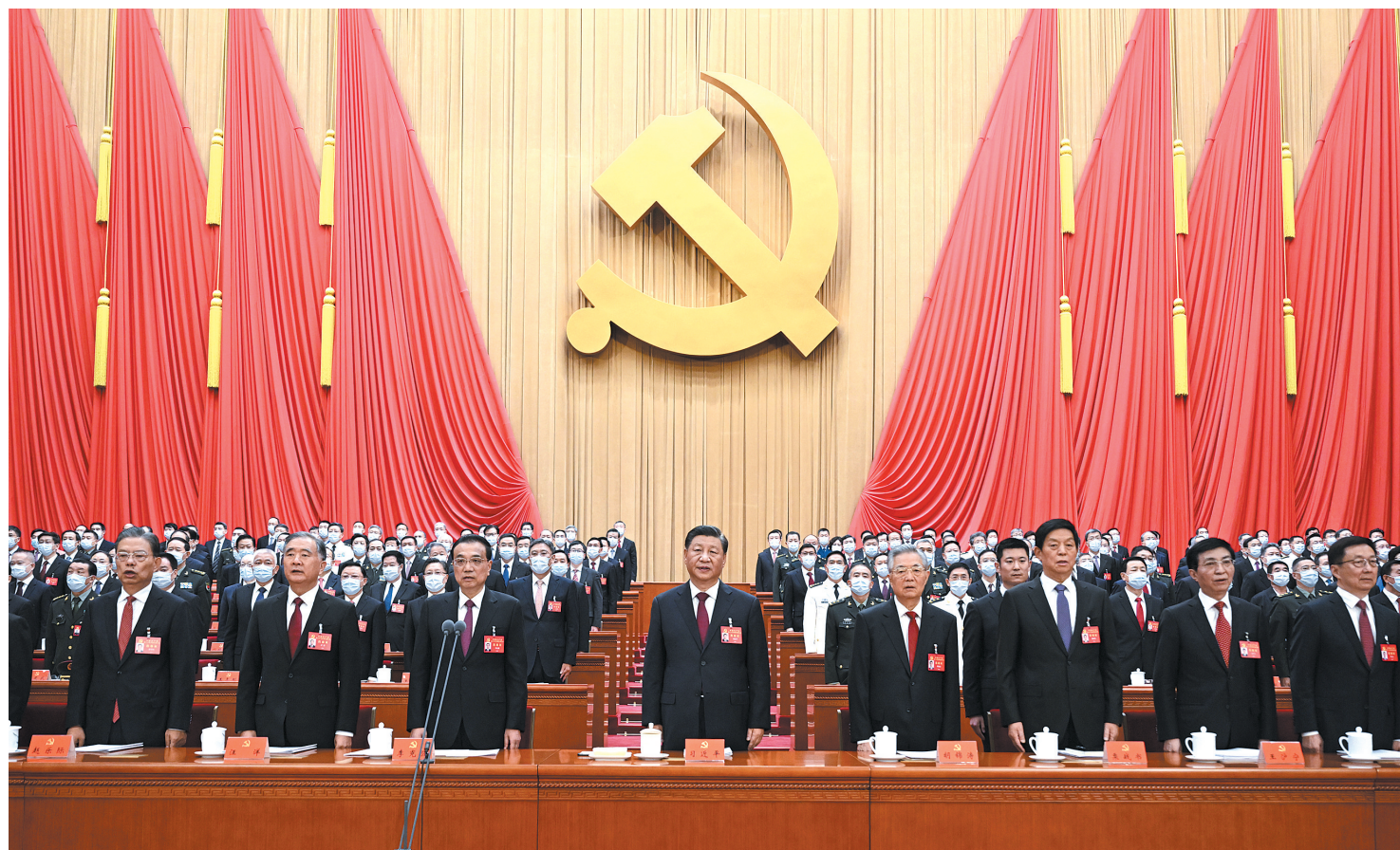
▲10月16日，中国共产党第二十次全国代表大会在北京人民大会堂开幕。这是习近平、李克强、栗战书、汪洋、王沪宁、赵乐际、韩正、胡锦涛在主席台上。