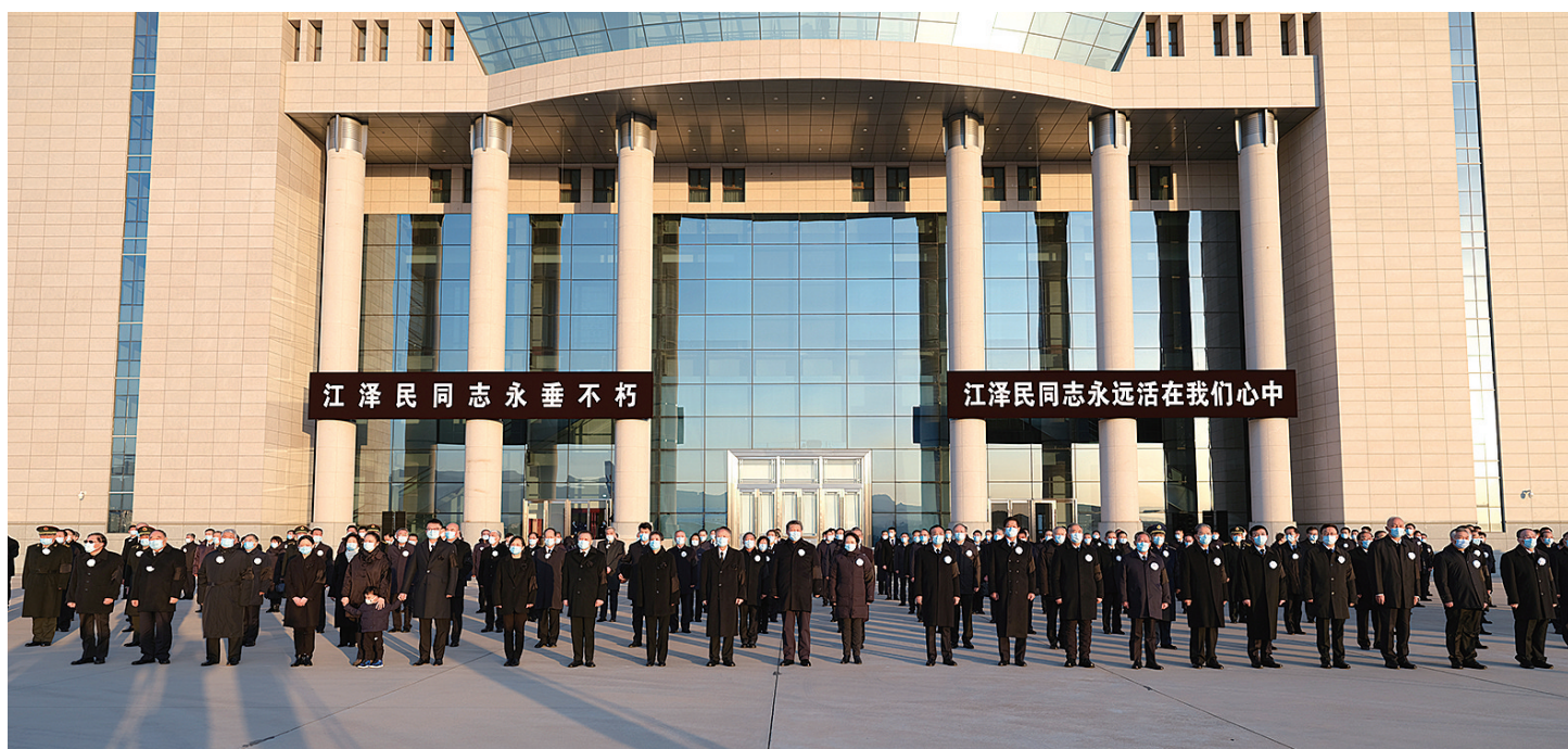
▲12月1日，江泽民同志的遗体从上海由专机敬移到达北京。习近平、李克强、栗战书、汪洋、李强、赵乐际、王沪宁、韩正、丁薛祥、李希、王岐山等党和国家领导同志到北京西郊机场迎灵。蔡奇等从上海护送江泽民同志遗体回到北京。

新华社北京12月1日电 我党我军我国各族人民公认的享有崇高威望的卓越领导人，伟大的马克思主义者，伟大的无产阶级革命家、政治家、军事家、外交家，久经考验的共产主义战士，中国特色社会主义伟大事业的杰出领导者，党的第三代中央领导集体的核心，“三个代表”重要思想的主要创立者江泽民同志的遗体今天从上海由专机敬移到达北京。