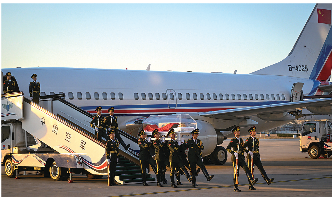
▲12月1日，江泽民同志的遗体从上海由专机敬移到达北京。