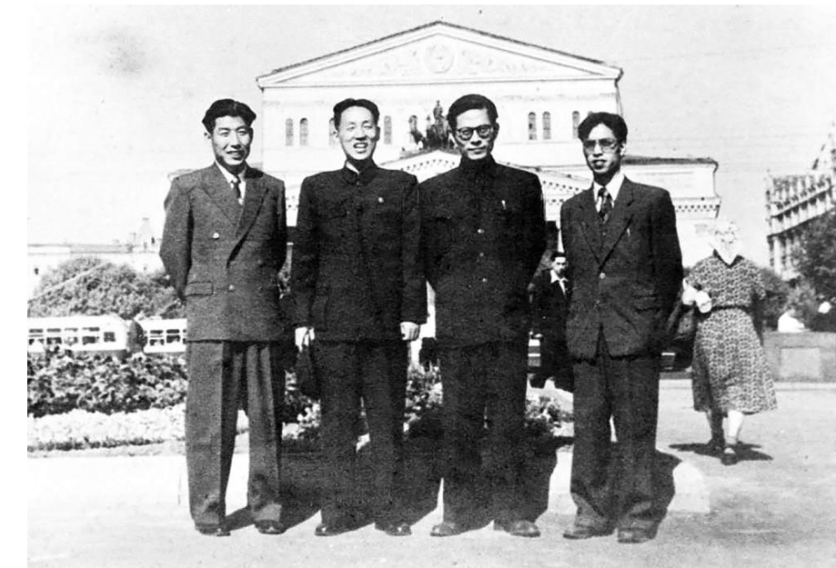
▲1955年至1956年,江泽民同志(右二)曾在莫斯科斯大林汽车制造厂实习。这是江泽民等在莫斯科合影。