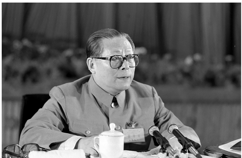
▲1989年6月23日至24日,中国共产党第十三届中央委员会第四次全体会议在北京召开。这是江泽民同志在会上讲话。