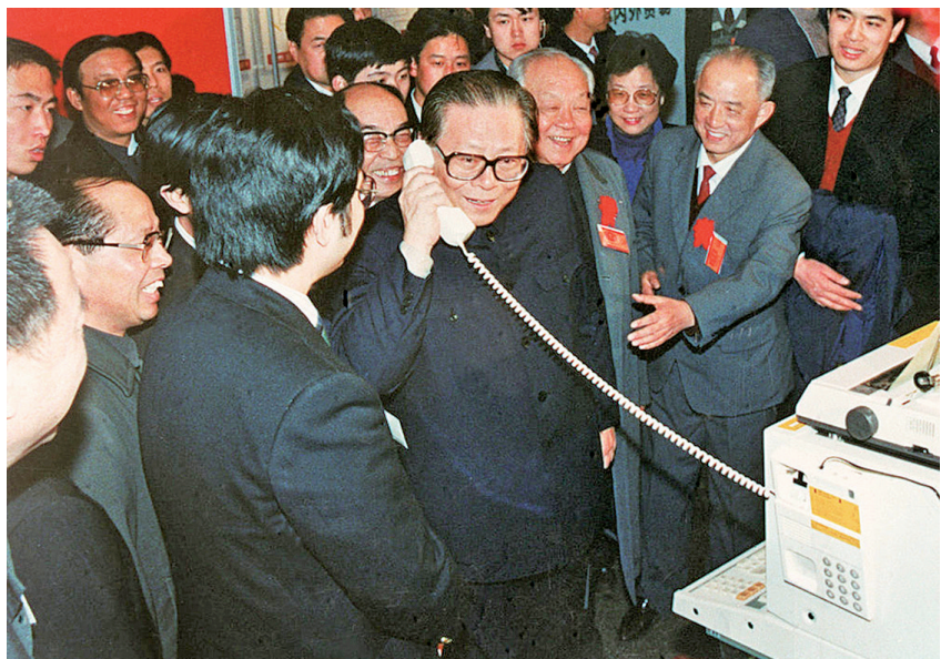
▲1984年5月,江泽民同志在北京展览馆举行的全国电子新产品展览会上,试用国际长途电话向远方的工作人员问候。