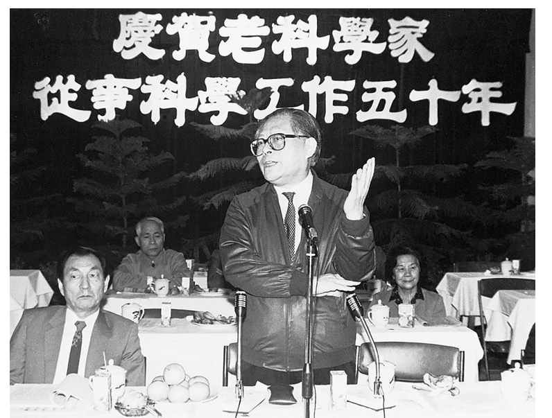
▲1988年10月,江泽民同志在上海庆贺老科学家从事科学工作五十年座谈会上讲话。