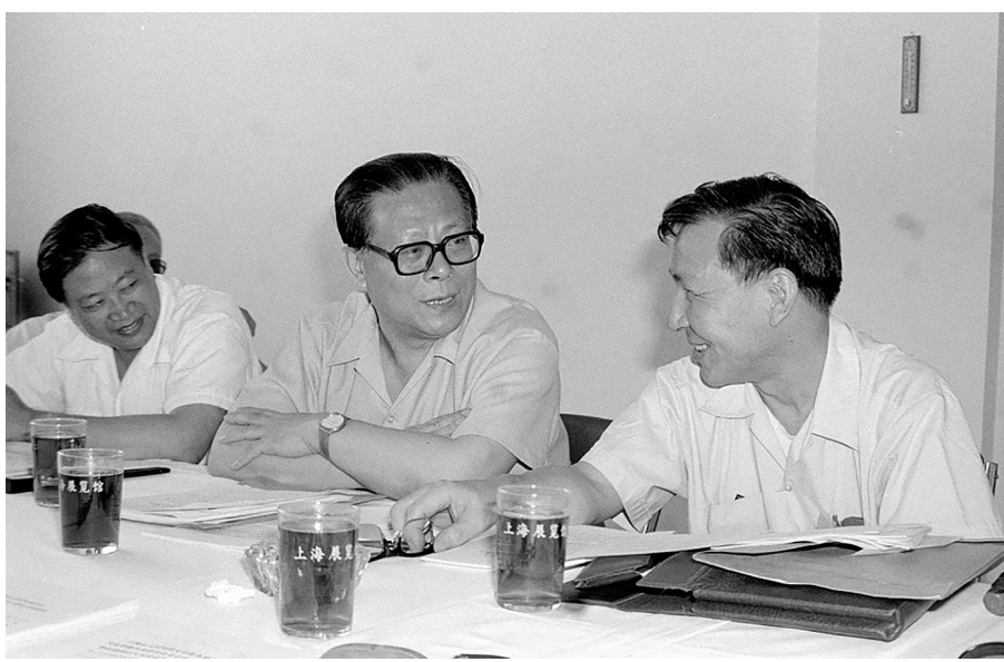
▲1985年,江泽民同志在上海市八届人大四次会议上。