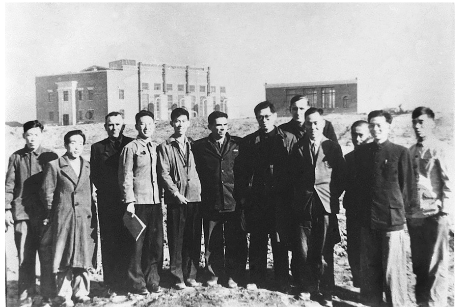
▲1956年,江泽民同志(左七)在长春第一汽车制造厂同援建一汽的苏联专家等合影。