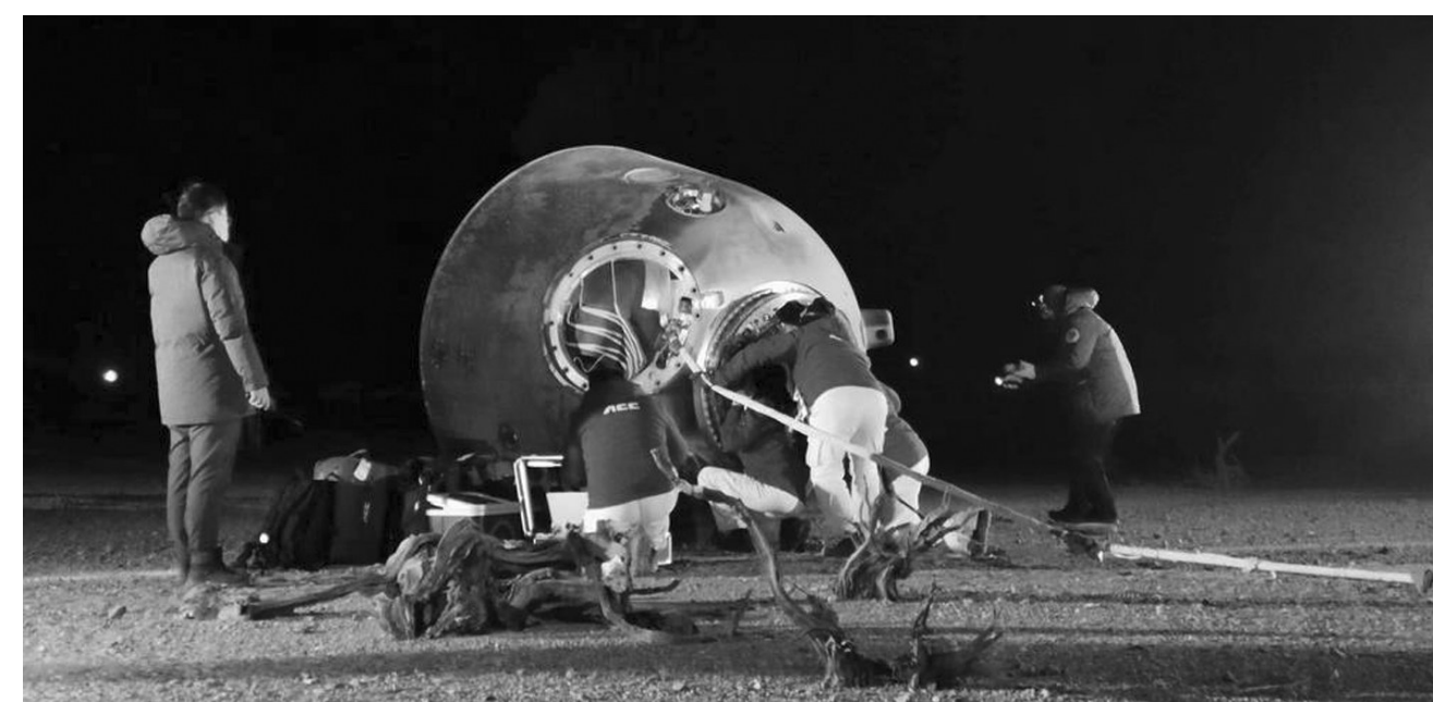
▲现场医监医保人员确认航天员陈冬、刘洋、蔡旭哲身体状况良好。新华社