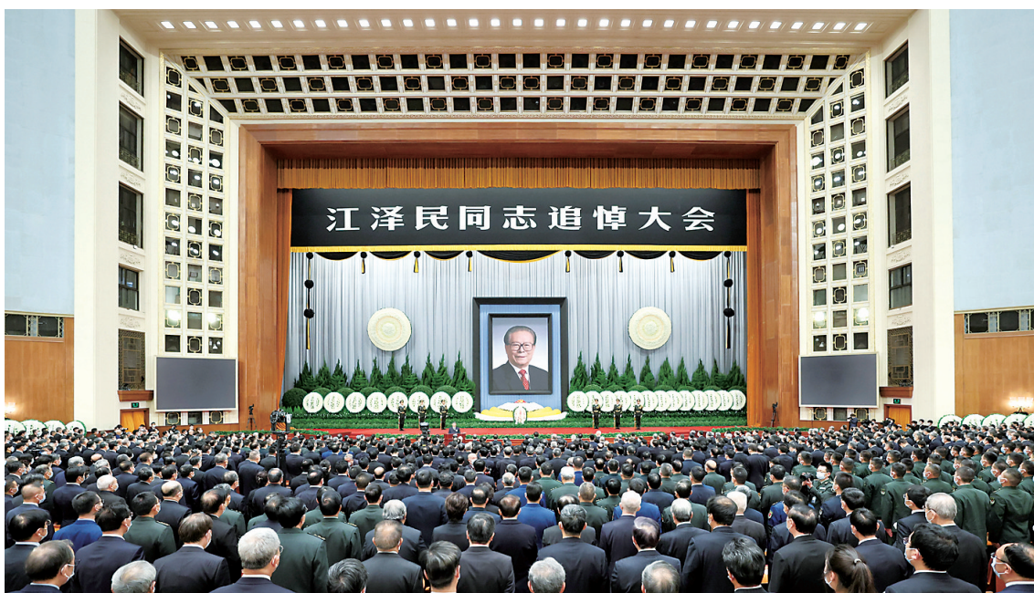
▲12月6日，中共中央、全国人大常委会、国务院、全国政协、中央军委在北京人民大会堂隆重举行江泽民同志追悼大会。