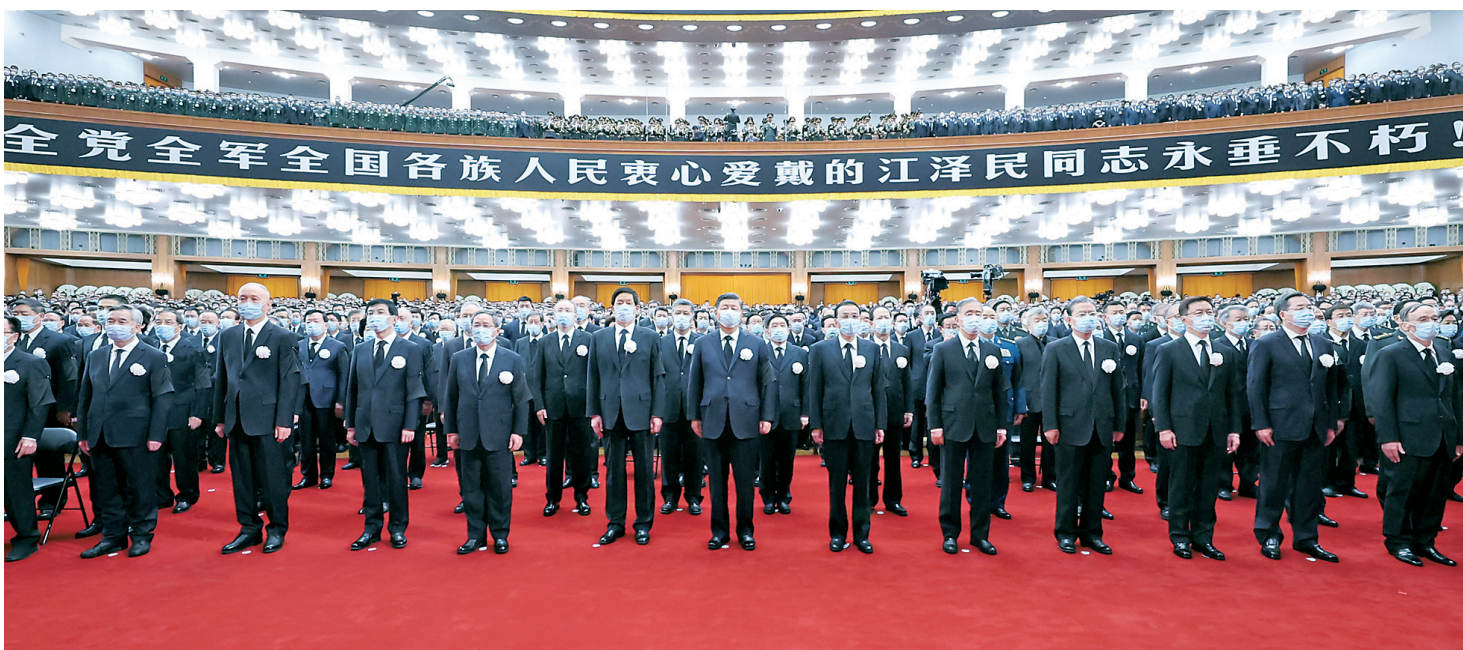
▲12月6日，中共中央、全国人大常委会、国务院、全国政协、中央军委在北京人民大会堂隆重举行江泽民同志追悼大会。习近平、李克强、栗战书、汪洋、李强、赵乐际、王沪宁、韩正、蔡奇、丁薛祥、李希、王岐山等参加大会。