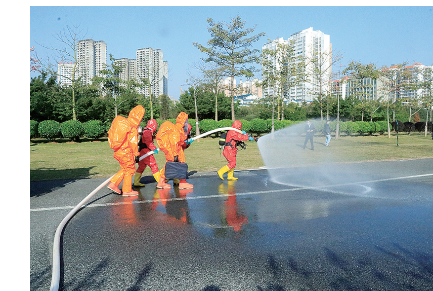
▲消防救援人员在演练中控制泄漏源。