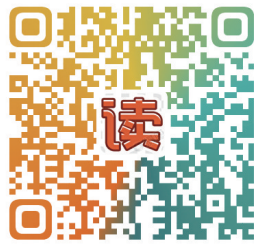
扫码聆听更多夜读美文

未来的个性发展与生活指向。 我想我得感谢命运,让来宾成为我生命里的城。被一片片甘蔗地包围的城市,有一种精神的自由,更有一种生命的张力,一切都“刚刚好”的甜蜜。 “心容天下,敢为人先。”来宾人以一颗包容开放的心,让外来人口感受到城市的温馨,融入城市的生活,用勤劳勇敢的本色建设充满希望的新来宾——这方甜蜜的土地。