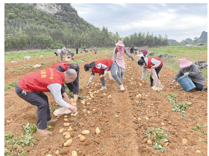
近年来,平阳县党委、政府充分利用冬闲田发展冬粮生产,把发展冬种马铃薯生产作为“短平快”项目,促农增收、助民增收。目前,该镇冬种马铃薯约400亩,亩产量在3000斤-4000斤。图为4月10日,该镇组织志愿者到辖区“早改水”基地帮助农户收拣马铃薯。

近年来,兴宾区紧紧围绕农业高质量发展要求,深入实施“藏粮于地、藏粮于技”战略,大力推进“早改水”项目。同时,积极贯彻落实各项强农惠农政策,鼓励引导种粮大户、合作社等进行规模化种植,示范带动农户转变粮食生产方式,稳步提升粮食生产,助力乡村振兴。(樊佩莹 覃丽献 何凤瑶)