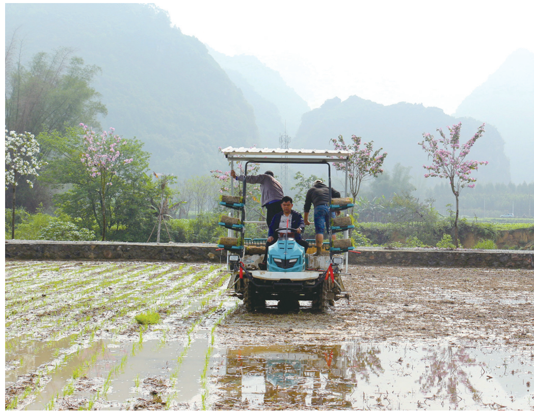
4月11日,在七洞乡211亩“早改水”片区高产水稻核心示范区的高标准农田里,插秧机来回穿梭,拉开早稻插秧序幕。近年来,该乡大力实施“藏粮于地、藏粮于技”战略,以七洞乡惠农农机专业合作社为托,使用全自动水稻育秧流水线,实现工厂化育秧。该合作社备有插秧机、翻耕机、收割机等农机,可提供育秧、机插、植保、收割、烘干、加工等全程机械化服务。