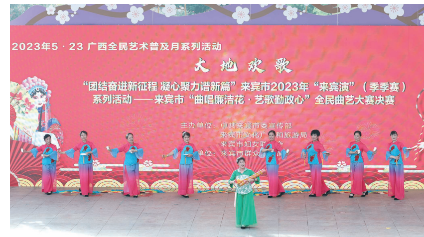
▲曲艺节目《致富路上的领路人》。