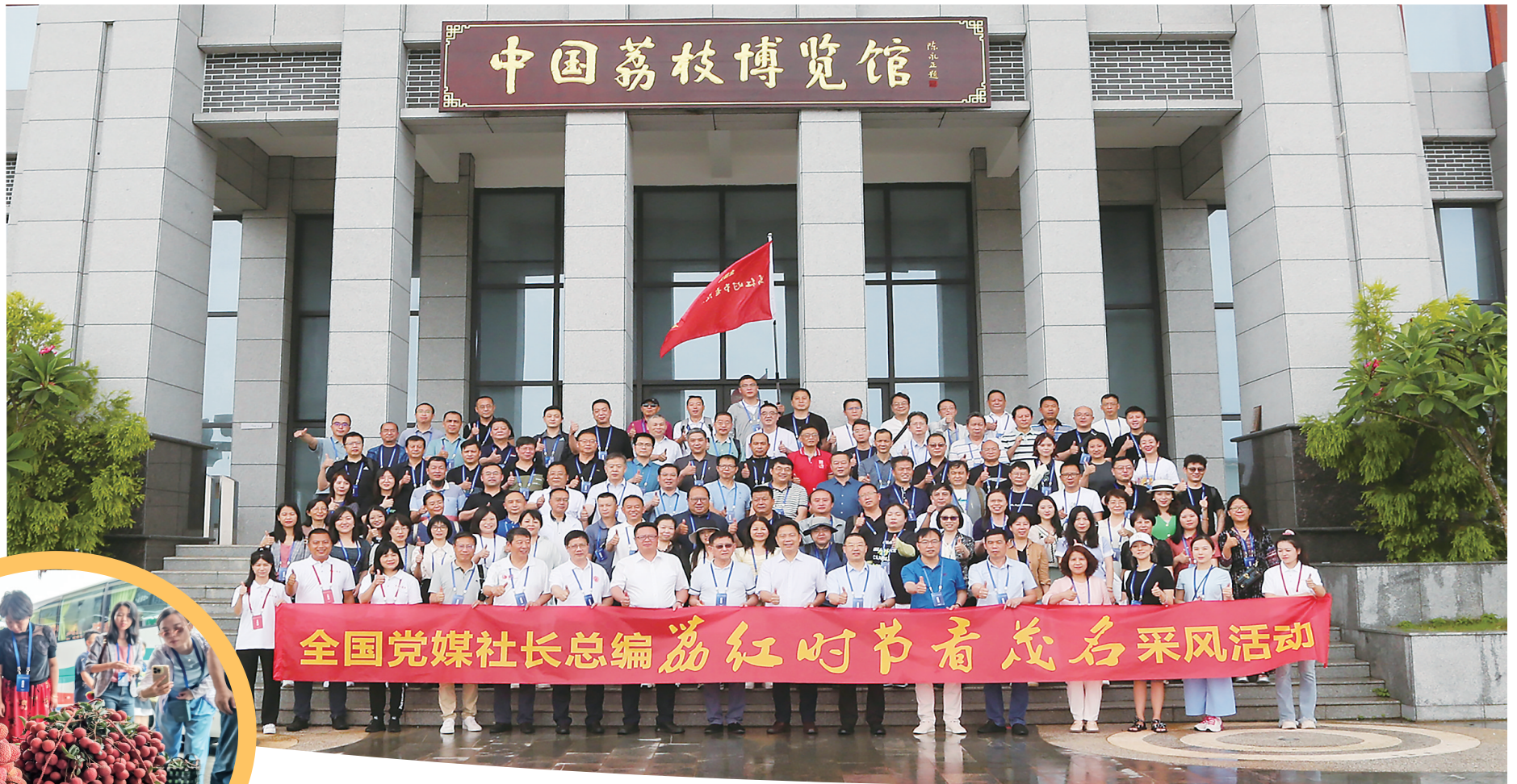
全国党媒社长总编荔红时节看茂名采风活动

每到一处,采风团都拿出手机、相机拍照,详细了解茂名乡村振兴工作亮点,记录茂名各地发展图景,纷纷点赞茂名在推动乡村振兴发展工作中所取得的显著成效,对茂名乡村振兴未来发展充满信心和期待,表示将彰显媒体担当,发挥好“桥梁”“纽带”作用,用心、用情讲述茂名乡村振兴故事,传播茂名,让更多人了解茂名。