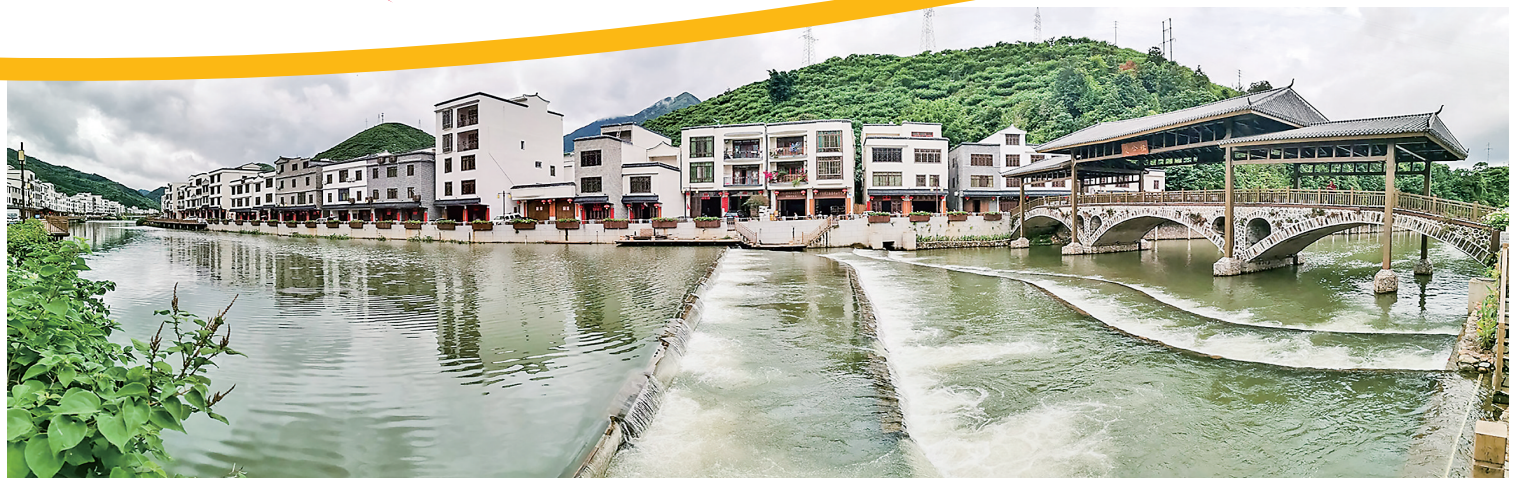
信宜市钱排镇双合村。