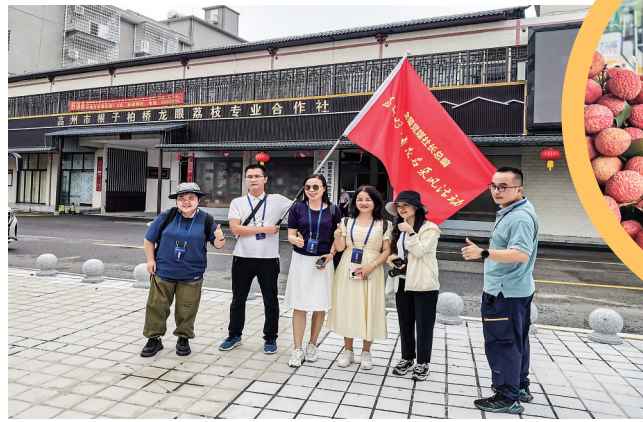
参观高州市根子镇柏桥龙眼荔枝专业合作社。