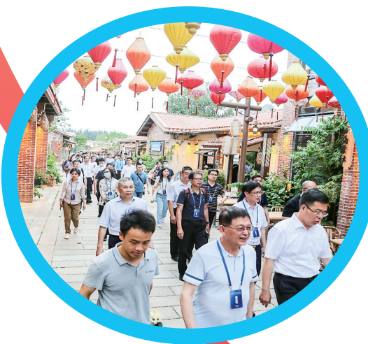
采风团参观电白塘霞俚街。