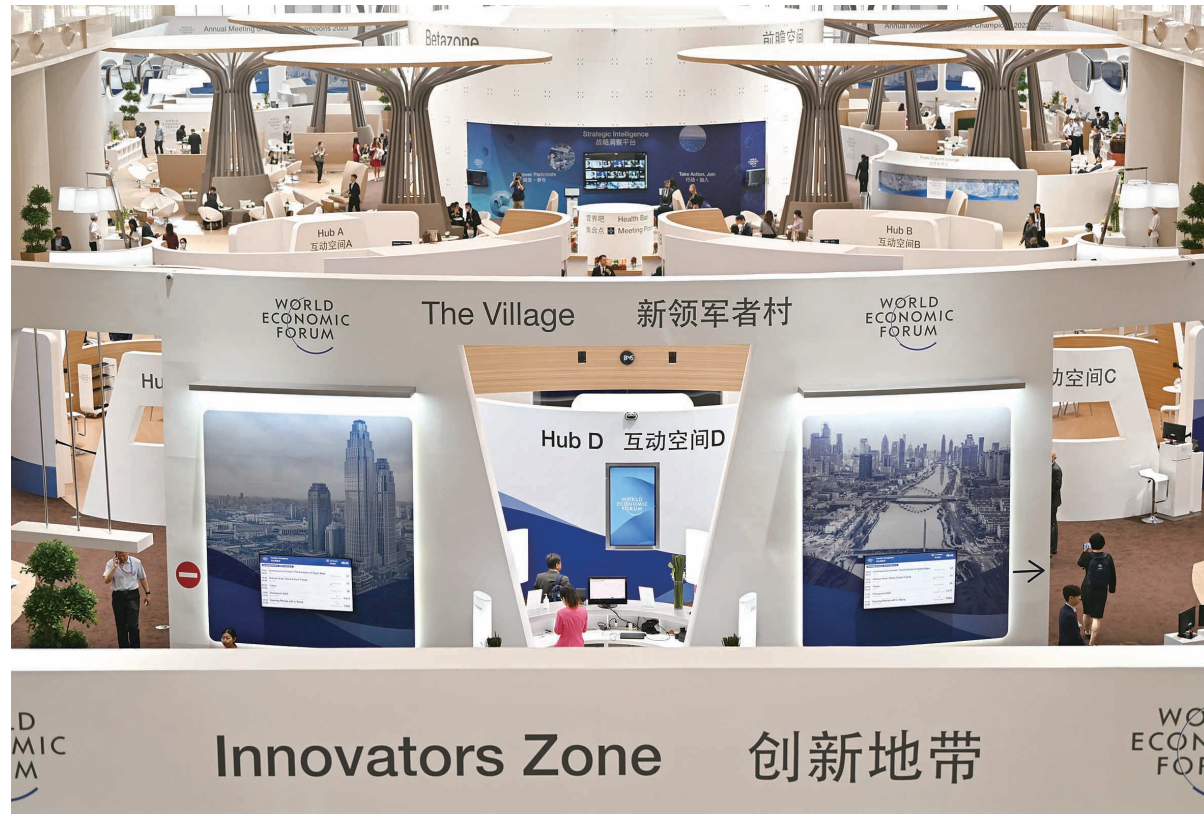
▲6月27日,第十四届夏季达沃斯论坛现场。

与会嘉宾在论坛期间强调,在当前全球贸易增长放缓、地缘凝聚力缺乏的背景下,如果再出现分裂和“脱钩”,世界经济复苏会变得更加困