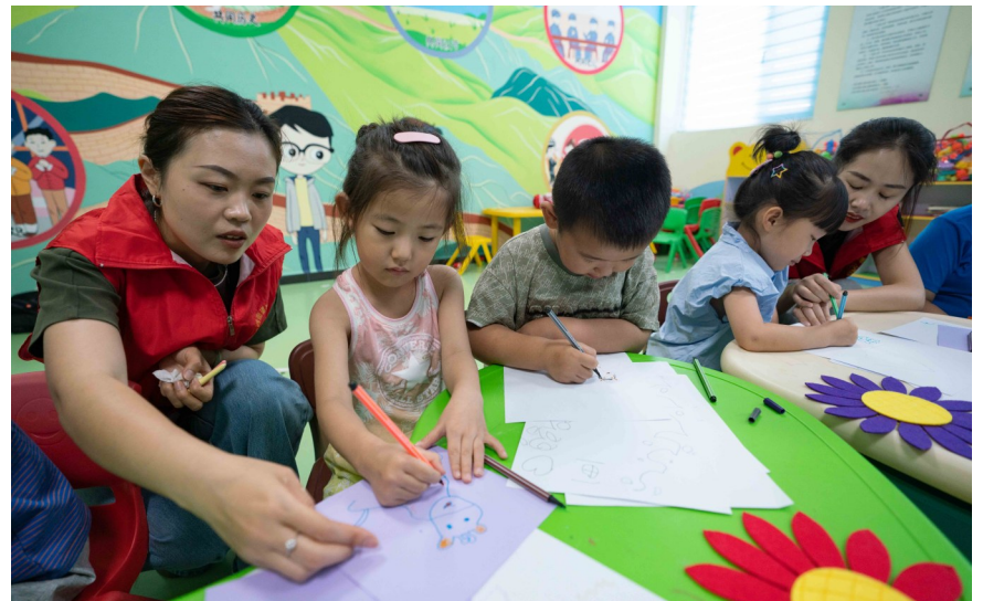
▲7月6日,在黄骅市海滨学院社区“多彩暑期·向阳花开”公益课堂,志愿者教孩子们画画。

暑假到来,河北省黄骅市海滨学院社区根据居民需求,提供精准化服务,开设“多彩暑期·向阳花开”公益课堂,邀请大学生、书画爱好者、剪纸艺人等志愿者为青少年义务辅导作业、教授技艺,丰富孩子们的暑期生活。